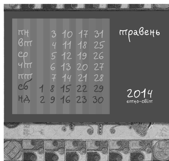
Рис. 2. "Етно-світ 2014". Автор Ю. Громова. Квітень-травень