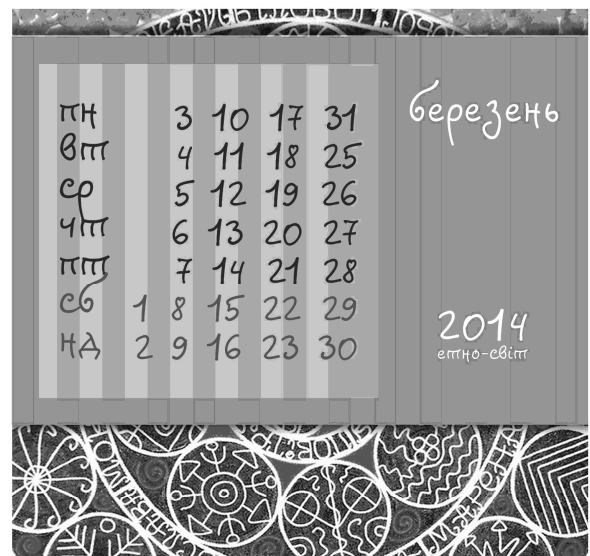
Рис. 1. "Етно-світ 2014". Автор Ю. Громова. Лютий-березень