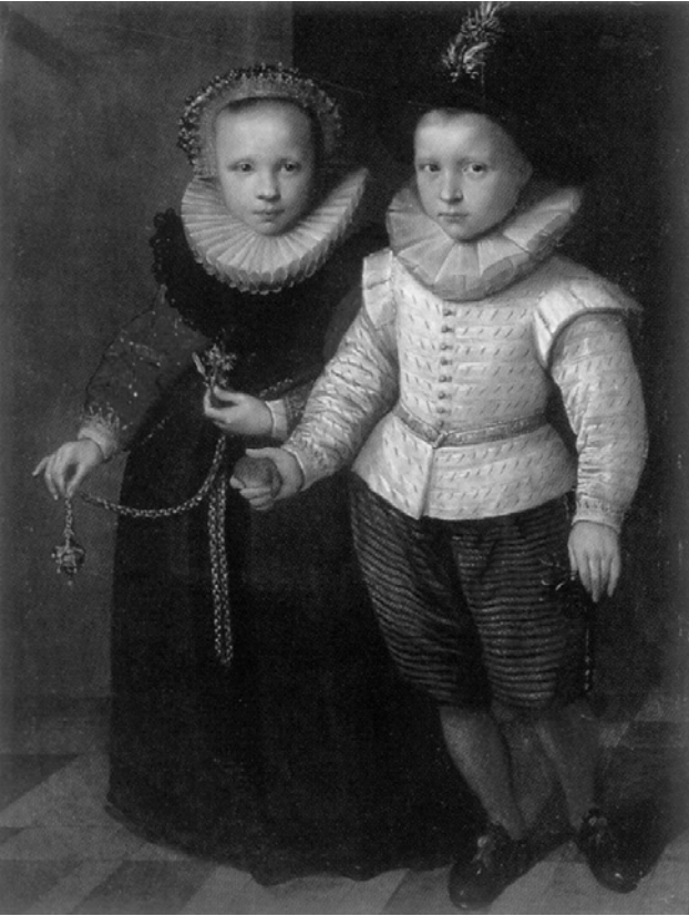
Рис. 14. К. Кетель. Портрет брата та сестри. II пол. XVI ст.