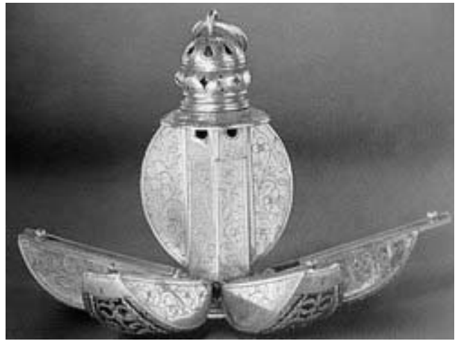
Рис. 4. Помандер. Англія. 1580-ті рр.