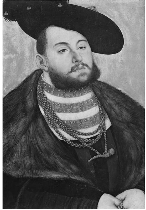
Рис. 15. Л. Кранах Ст. Портрет Йоганна Фрідріха, курфюрста Саксонського. 1531.