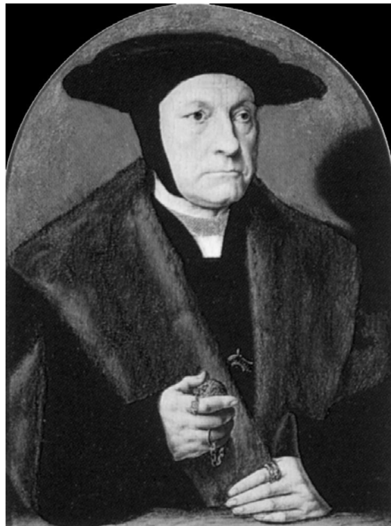
Рис. 9. Б. Брейн. Чоловічий портрет. 1538-39 рр.

Німецькі майстри теж не рідко зверталися у портретному жанрі до зображення аксесуарів – для них це було більш, ніж природно, зважаючи на школу ювелірів, яку всі вони проходили в той період. Помандери можна побачити на портретах пензля Г. Бальдунга Гріна ("Портрет молодика з розарієм", 1509), Б. Штрігеля ("Портрет Сібілли фон Страйберг, уродженої Госсенброт", межа XVI–XVI ст.), швабського художника поч. XVI ст. з долини Неккара ("Портрет Міхаеля Фіклера", 1531). Цікавий за формою помандер висить на шийному ланцюгу курфюрста на портреті Лукаса Кранаха Старшого ("Портрет Юганна Фрідріха, курфюрста Саксонського"). Він зроблений у вигляді стилізованого дельфіна, що тримає в пащі кульку – власне саму ароматницю (рис. 15).