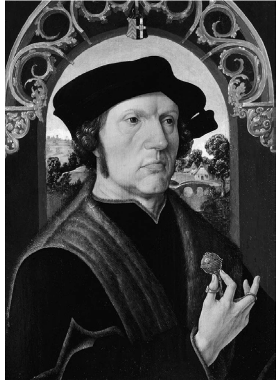
Рис.7. Я. К. ван Оостанен. Портрет чоловіка з помандером у руках ("Портрет Яна Геррітца ван Егмонд ван де Даенборг"). 1517 р.