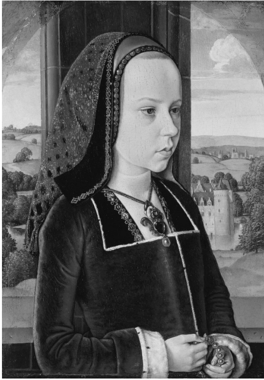
Рис. 6. Муленський майстер. Жіночий портрет. Кінець XV ст.