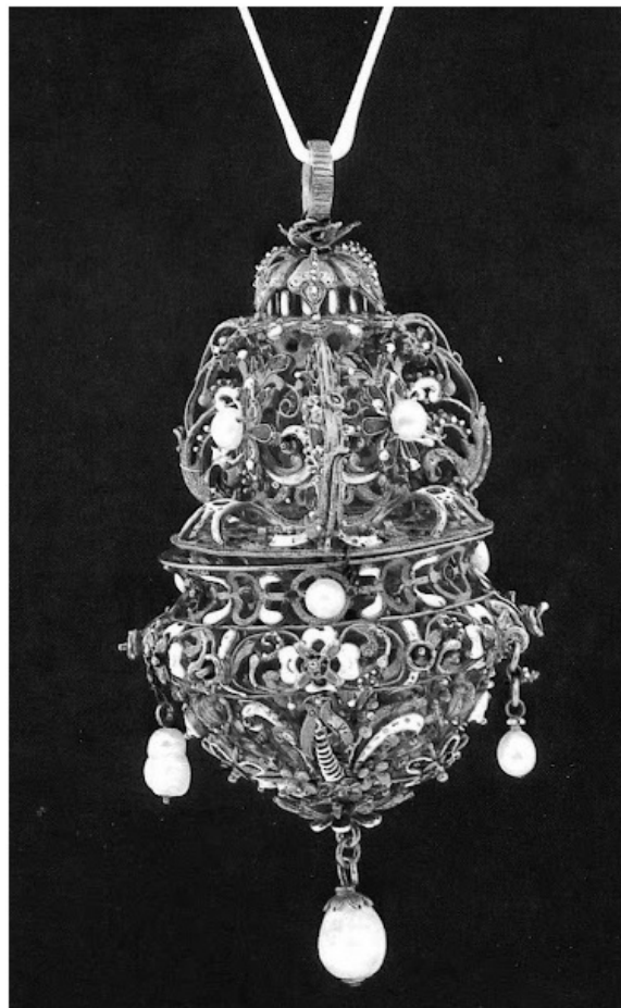
Рис. 5. Помандер. Північно-Східна Європа. Кінець XVI ст.

Золоті або срібні (часто – позолочені) помандери прикрашали гравіюванням, ювелірним камінням, емаллями. Помандери мали досить складну конструкцію – склалися з футляра, в якому власне і розміщували ароматну кульку. Пізніше замість зовнішнього футляра, круглого за формою, з'явилися своєрідні рухомі пелюстки, які, розкриваючись, нагадували квітку. З XVI ст. цих "пелюсток" почали робити чотири або шість – кожна призначалася для вміщення певного різновиду пахоців. Переважали у складі субстанцій, що наповнювали помандери, мускус, амбра, цибет, кориця, пахучі трави [6, 116].