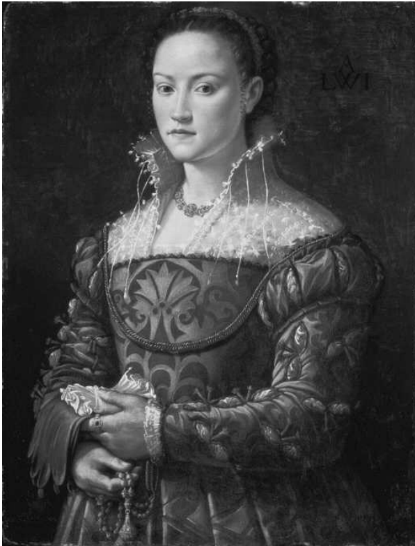
Рис. 16. Б. Венето. Дама в зеленому. 1542 р.