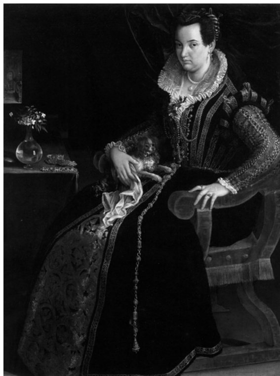
Рис. 19. Л. Фонтана. Портрет Констанції Алідрзі. 1594 р.

З часом помандери втрачають популярність, яку мали у XV–XVI ст., відходять на дальній план, але час від часу можна побачити використання цього вишуканого аксесуару в різних державах, і не тільки європейських. Зустрічатимуться вони надалі і в інтер'єрах, відповідаючи за формою і стилістичними рисами оздоблення декору вимогам часу. На жаль, досліджувати помандери як витвори ювелірного мистецтва й важливі елементи вбрання, можливо переважно завдяки зображенням їх на портретах тих часів. Оскільки ароматниці як прикраси робилися з коштовних металів та щедро прикрашалися, переважну їх більшість спіткала традиційна доля ювелірних виробів минулого – вони зникали з мистецької арени. Щось було перетворено на інші вироби, щось вкрадене і таким чином зникло з поля зору дослідників назавжди. До наших часів дійшли лише окремі зразки, тому документом, що допомагає висвітлювати способи користування помандерами та їхнє художнє оздоблення, в даному випадку виступають зразки живопису, які й надалі потребуватимуть детального вивчення та систематизації.