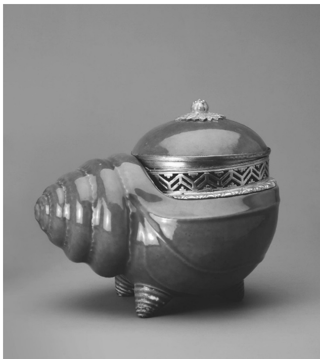
Рис. 2. Ароматниця у формі равлика. Франція. 1763-68 рр.

Доволі довго використовувалися ароматники і в Росії, але тут вони частіше були керамічними, інколи також у формі посудин, а подекуди могли являти собою і зразки дрібної пластики. Російські родини використовували як ароматниці місцевого виробництва (фарфорові ароматниці у вигляді східних чоловіка