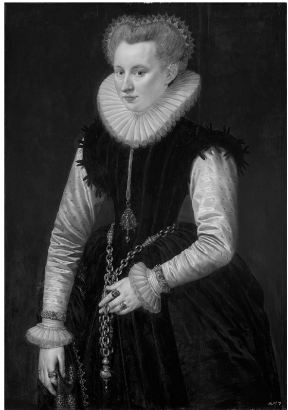
Рис. 13. Ф. Поурбюс Ст. Портрет дами. 1581 р.