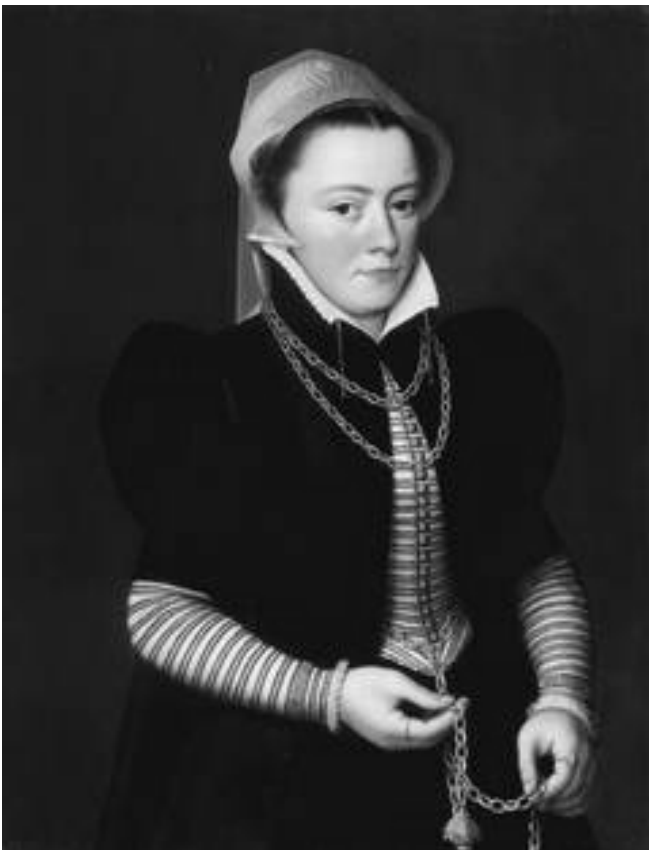
Рис. 12. Ф. Поурбюс Ст. Портрет дами. II пол. XVI ст.