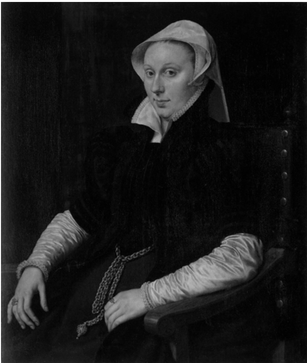
Рис. 10. А. Мор. Портрет Анни Фернелі, дружини Томаса Грешема. 1564 р.