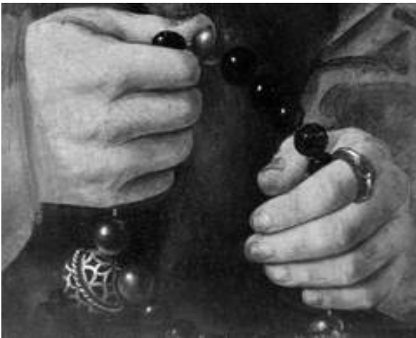
Рис. 3. Помандер як елемент чоток