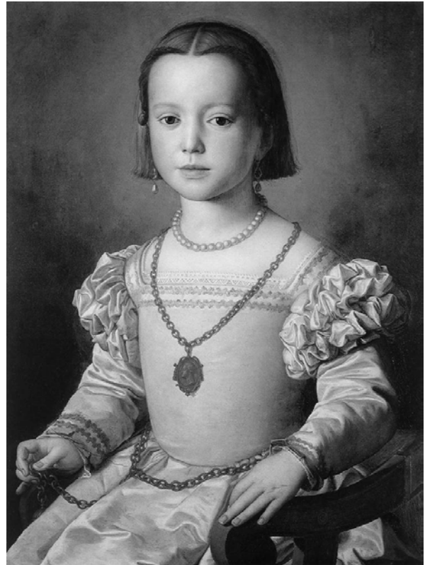
Рис. 17. Тіціан. Портрет Бії Медичі. 1542 р.