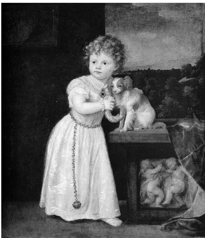
Рис. 18. Тіціан. Портрет Кларіче Строцці. 1542 р.

Вже наприкінці XVI ст., у 1594 р. Л. Фонтана створила портрет, що підтверджує схильність жінок того періоду до користування помандерами, хоча вже ближче до XVII ст. вони поступово втрачають таку небачену актуальність, якою користувалися, в силу зазначених причин, раніше (рис. 19).