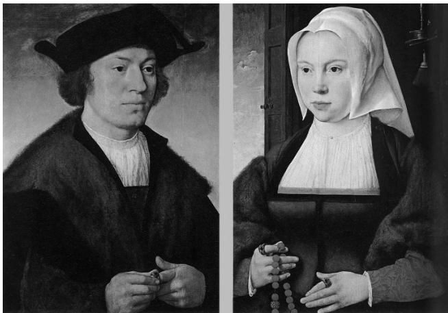
Рис. 8. Й. ван Клеве. Подвійний родинний портрет. 1520-27 рр.

тально, що можна оговорювати матеріал та техніку їх створення: портрет дами другої половини XVI ст." (рис. 12), "Портрет дами" 1581 р. (рис. 13). Цікавими є зображення помандерів у костюмах дітей, адже дитяче вбрання ренесансового періоду абсолютно точно повторювало доросле. Прикладом може слугувати подвійний портрет брата та сестри роботи К. Кетеля (II пол. XVI ст., рис. 14).