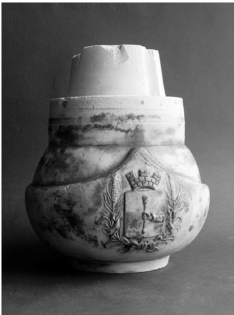
Гіпсова модель ковша, виготовлена в майстернях МХПШ. З рельєфним гербом м. Лубен. Початок XX ст. Музей МХПК.