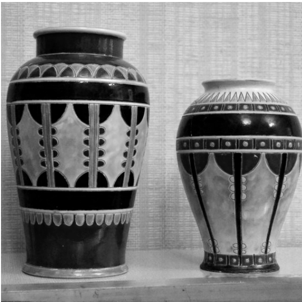
Керамічні вази виготовлені на фабриці І. Левинського. Початок ХХ ст. З експозиції музею МХПК.