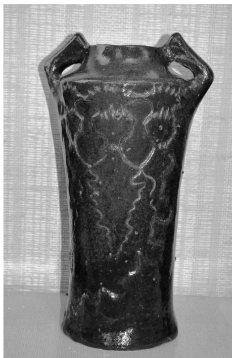
Майолікова ваза, виготовлена в майстернях МХПШ. Початок XX ст. З експозиції музею МХПК.