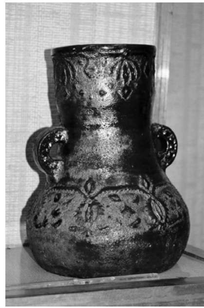
Майолікова ваза, виготовлена в майстернях МХПШ. Вкрита металізованою поливою відновного вогню. Початок XX ст. З експозиції музею МХПК.