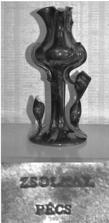
Майолікова ваза, виготовлена мануфактурою "Жолнаї" та марка зі звороту ніжки (збільшено). Виріб вкрито іризаційною поливою. Початок XX ст. З експозиції музею МХПК.