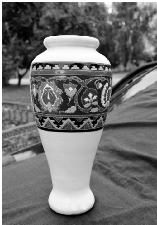
Майолікова ваза, виготовлена в майстернях МХПШ. Початок XX ст. Приватна збірка.