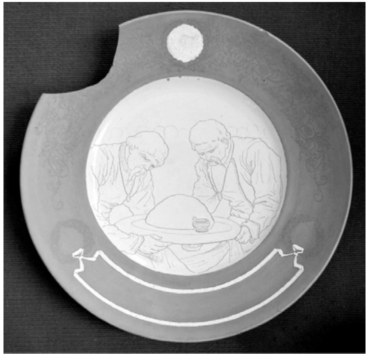
Майоліковий таріль, виготовлений в майстернях МХПШ. Автор О. Сластьон. З експозиції музею МХПШ. Початок XX ст.