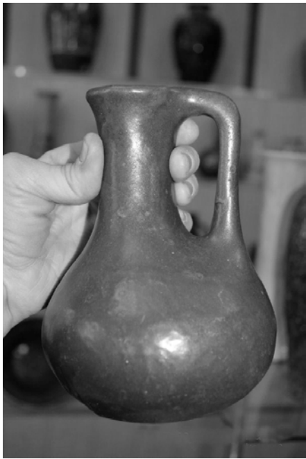
Майолікова ваза, виготовлена в кераміко-художній майстерні "Абрамцево". Вкрита поливою відновного вогню. Початок XX ст. З експозиції музею МХПК.