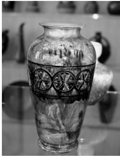
Майолікова ваза, виготовлена в майстернях МХПШ. Вкрита потічними поливами. Початок XX ст. З експозиції музею МХПК.