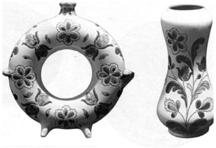
Керамічні вироби Коломийської гончарної школи. Початок ХХ ст. Фонд Музею етнографії та художніх промислів у Львові.