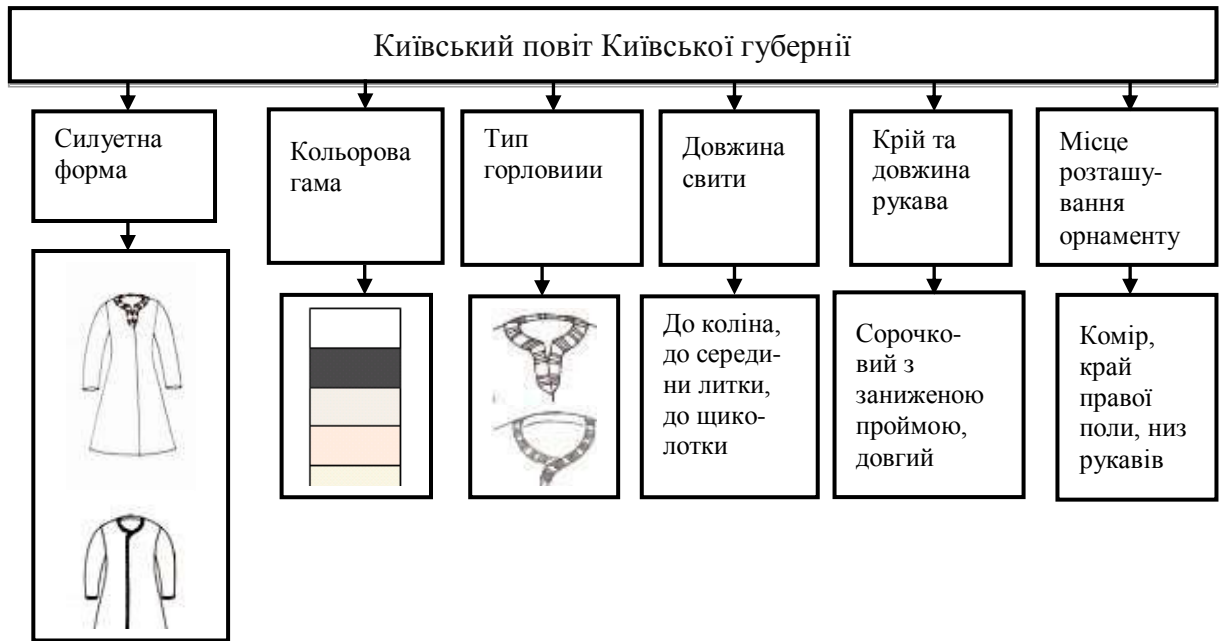
Рис. 1. Класифікація художньо-композиційних елементів українських свит (Київський повіт).

зовсім без орнаменту, свити мешканок Таращанського, Черкаського та Чигиринського повітів.