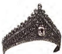
РИСУНОК 16 – Бриллиантовая диадема императрицы Елизаветы Алексеевны. Москва, Алмазный фонд