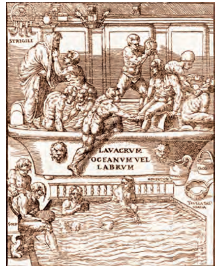
РИСУНОК 10 – Атлеты в плавательном бассейне. Литография из книги И. Меркуриалиса «Искусство гимнастики»

как духовность, вдохновение, божественное вмешательство, благородство, честь, скромность, превосходство, гуманизм, патриотизм, слава, почет. Олимпийский оливковый венок становится популярным поэтическим символом чистоты, благородства и святости, защиты от дегуманизации общества, против жадности и стремления к обогащению.