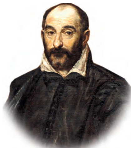
РИСУНОК 3 – Андреа Палладио – выдающийся архитектор позднего Возрождения, основоположник классицизма. На примере простых и изящных построек продемонстрировал, как достижения античности и высокого Возрождения могут быть творчески переработаны и использованы. Ему удалось сделать классический стиль архитектуры общедоступным и универсальным

В течение XVII–XVIII вв. классицизм, а затем неоклассицизм стали господствующим направлением в философии, литературе, образовании, архитектуре, строительстве и искусстве. Для неоклассицизма эстетической ценностью обладало лишь непреходящее и неподвластное времени, и в этом отношении