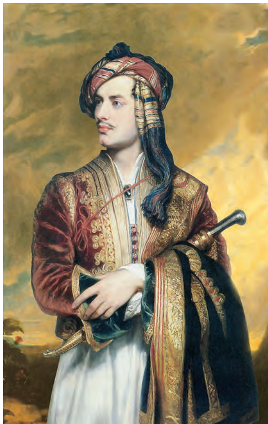
РИСУНОК 11 – Портрет лорда Байрона. Филипп Томас. Лондон, Национальная портретная галерея

К числу наиболее значительных трудов по истории древнего мира относится и произведение известного немецкого археолога, топографа и историка Эрнста Курциуса «История Древней Греции» [5]. Среди его заслуг — организация и осуществление раскопок в