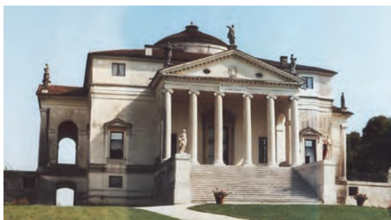
РИСУНОК 4 – Вилла Ротонда – первая светская постройка эпохи Возрождения, увенчанная куполом

В Германии от форм рококо, отмеченных римским влиянием, был сделан крутой поворот в сторону греческих форм. Это особенно заметно в таком архитектурном сооружении как Бранденбургские ворота в Берлине, строительство которых завершилось в 1791 г. Интенсивное развитие неоклассицизма началось в этой стране после революции 1848–1849 гг. Стремление к благородной простоте и спокойному величию античного искусства ярко проявилось в создании фасадов, колонн, треугольных фронтонов, скопированных у древних греков, что стало архитектурной азбукой. В стиле классицизма строились не только дворцы, но и загородные дома, виллы, общественные здания – университеты, театры, музеи, библиотеки. Увлечение дошло до того, что во многих городах Германии (Потсдам, Дармштадт, Карлсруэ) в этом стиле были построены даже церкви, хотя и велись дискуссии о том, насколько языческие архитектурные формы соответствуют христианским обителям [3] (рис. 5).