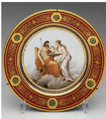
РИСУНОК 7 – Desertный фарфоровый сервиз «Олимпийский» выполнен на северских мануфактурах в 1803–1806 гг. Дар императора Наполеона I императору Александру I. Оружейная палата Московского Кремля

Данное течение в искусстве находит широкое распространение и в американской