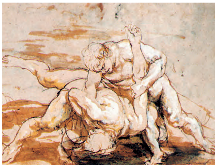
РИСУНОК 13 – Борющиеся панкратионисты. Питер Пауль Рубенс, XVII в.

В Киевском национальном музее русского искусства находится картина русского живописца Василия Верещагина. На полотне изображена сцена состязания борцов на Олимпийских играх (рис. 15).