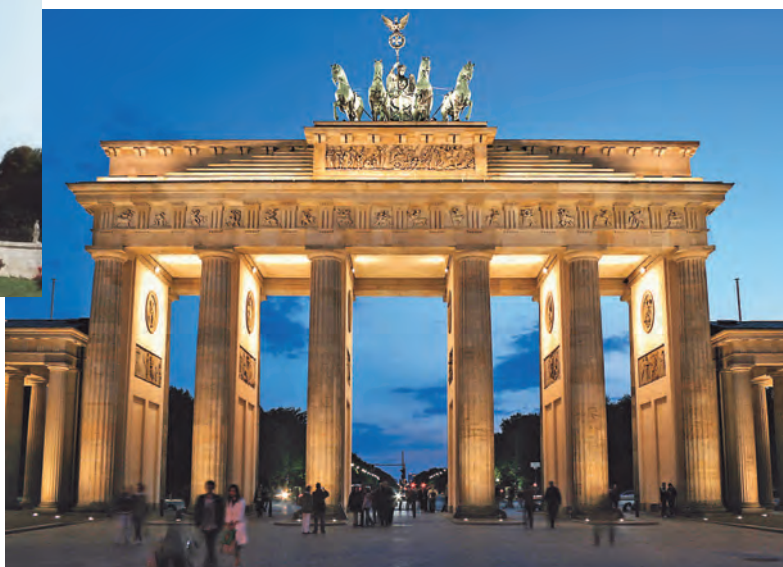
РИСУНОК 5 – Бранденбургские ворота – символ Германии, образец архитектуры классицизма (Лангганс Карл Готтгард, 1789–1791 гг.)