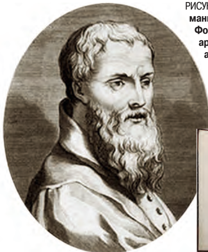
РИСУНОК 1 – Себастьяно Серлио – архитектор-маньерист позднего Ренессанса из школы Фонтенбло. Один из ведущих теоретиков архитектуры этой эпохи, основоположник архитектуры классицизма, основатель нового архитектурного стиля. В 1539 г. по его проекту был построен деревянный театр в Виченце во дворе дворца Порто, в котором использовались законы перспективы с учетом античных традиций

В историю архитектуры С. Серлио вошел как автор известной книги «Общие правила архитектуры» (отдельные книги публика-