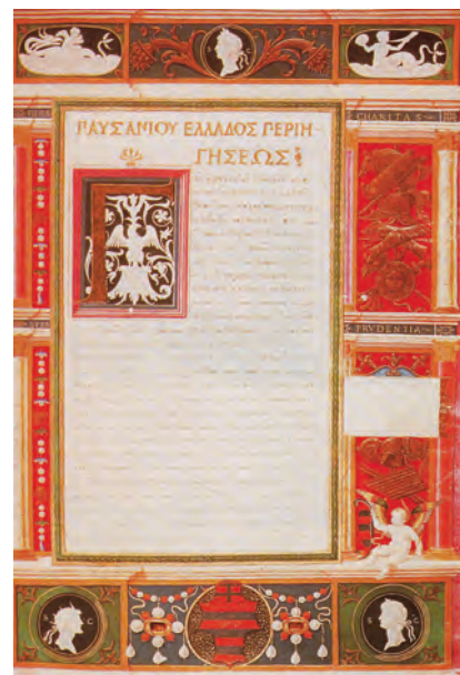
РИСУНОК 9 – Фронтиспис издания «Описание Эллады». Павсаний. Прибл. 1516. Флоренция, библиотека Лауренциана

В произведениях многих писателей и поэтов разных стран, включая Уильяма Шекспира (1564–1616 гг.), Иоганна Гете (1749–1832 гг.), Гюстава Флобера (1821–1880 гг.), упоминания об Олимпийских играх отождествляются с такими понятиями