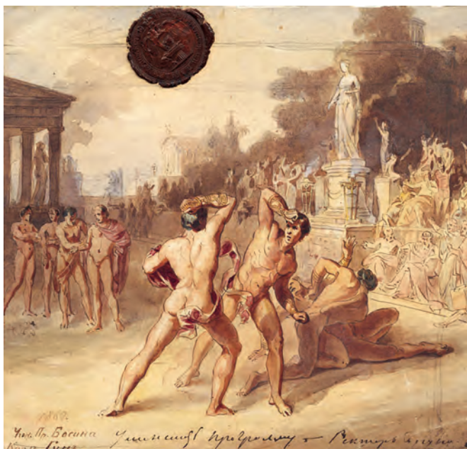
РИСУНОК 14 – Олимпийские игры. Гун Карл. 1860 г. Рига, Национальный художественный музей