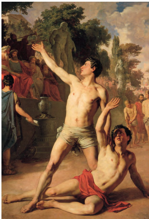
РИСУНОК 15 – Сцена из Олимпийских игр. Борьба. В. Верещагин. Киев, музей Русского искусства