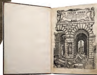
РИСУНОК 2 – Тракта об архитектуре Себастьяно Серлио