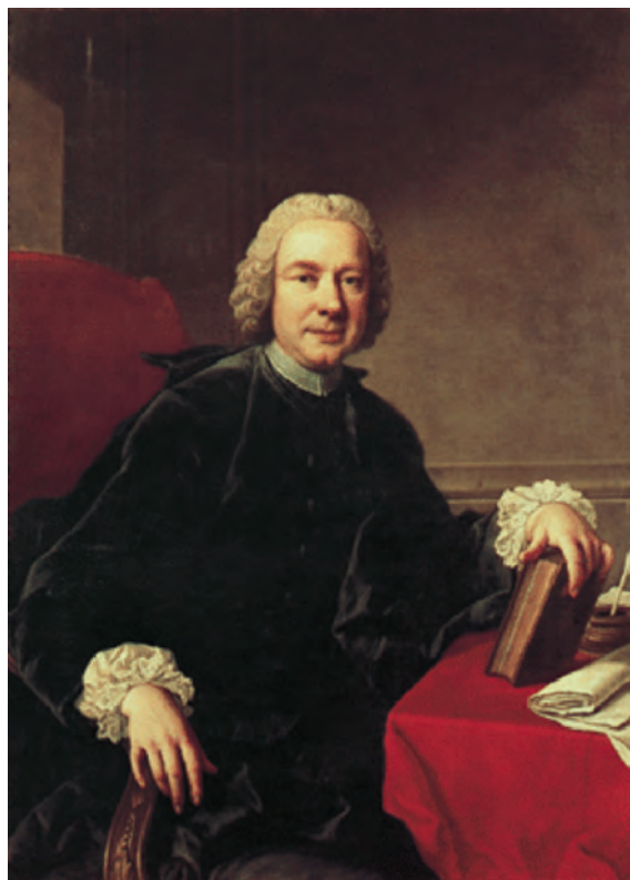
РИСУНОК 12 – Пьетро Метастазियो – видный итальянский поэт и драматург-либреттист

Своим творческим достижением известный художник из Женевы Жан-Пьер Сен-Урс считал полотно «Олимпийские