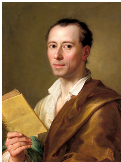
РИСУНОК 6 – Иоганн Винкельман – немецкий искусствовед, основоположник существующих в то время представлений об античном искусстве, науке, археологии. Менгс Рафаэль. Прибл. 1777 г. Нью-Йорк, Метрополитен-музей

Неоклассицизм в полной мере проявился в декоративном искусстве Австрии, Германии, Франции, Англии, России, стран