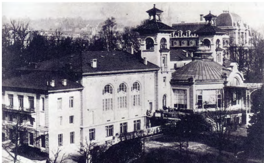
Казино де Монбенон было открыто в 1908 г., где впервые после Первой мировой войны собрался МОК. 6 апреля 1919 г. там состоялась 18-я сессия МОК. Роскошные помещения казино использовались для выставок, а также для офиса и Олимпийского института Лозанны, основанного Пьером де Кубертенем

Грабер, мэр Лозанны, побывал в 1952 г. на Играх в Хельсинки, которые произвели на него огромное впечатление. «Необыкновенная атмосфера, созданная энтузиазмом