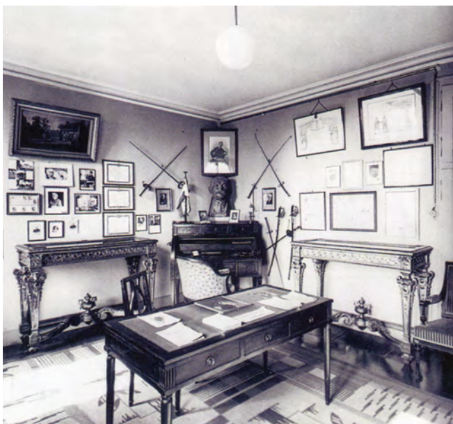
Олимпийский музей размещался в двух комнатах на первом этаже Мон-Репо, а помещение для секретариата – на четвертом этаже. Кабинет Кубертена был закрыт в 1970 г.

Через четыре года МОК вновь собрался в Лозанне, чтобы выбрать город, который будет принимать Олимпийские