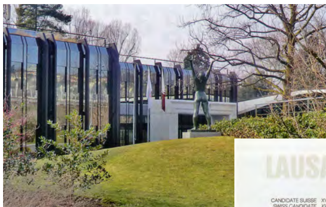
Олимпийский дом был открыт 12 октября 1986 г.

В декабре 1999 г. МОК вновь собрался в Лозанне на еще одну чрезвычайную сессию. Комиссия по реформам предложила 49 рекомендаций и установила лимит в 115 действующих членов МОК с возобновляемым сроком восемь лет пребывания в должности. Впервые члены Комиссии спортсменов стали полноправными членами МОК, и первые семь принесли присягу. Олимпийская клятва спортсменов тоже была модифицирована, включив упоминание