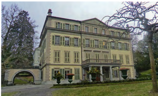
Вилла Мон-Репо – штаб-квартира МОК с 1922 по 1968 г. Ее история восходит к 1747 г., когда Генеральный контролер Абрахам Секретан выстроил здание на участке земли под названием Мон-Рибо