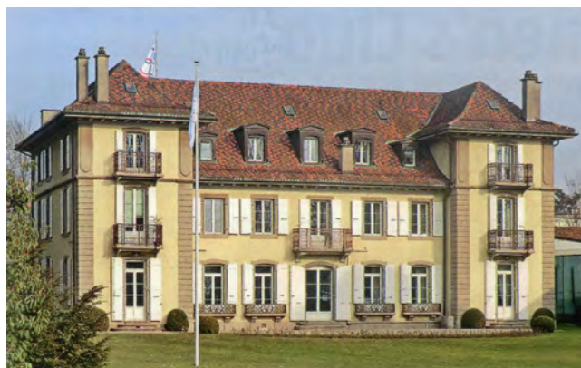
Город Лозанна открыл свободный доступ в Шато де Види для посещения публики в 1968 г., ранее там располагался Организационный Комитет Швейцарской национальной выставки 1964 г.