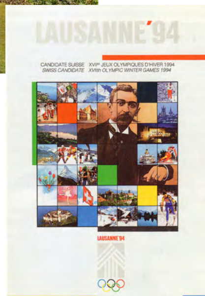
Лозанна вступила в борьбу за право принимать проведение зимних Олимпийских игр 1994 г., но затем отозвала свою заявку еще до этапа голосования. Город постигла неудача в конкурсах в 1939, 1946 и 1955 гг. на проведение летних Игр

На последней сессии в 2014 г. МОК поделился планами о выделении 160 млн долларов США (130 млн евро) на ремонт штаб-квартиры в Лозанне [17]. Использование солнечных батарей и новейших технологий по использованию воды из озера должен сделать город «Местом, которое уважает традиции и современность, сочетая эфемерность и динамику» [18]. По мнению МОК, такой обновленный олимпийский кампус