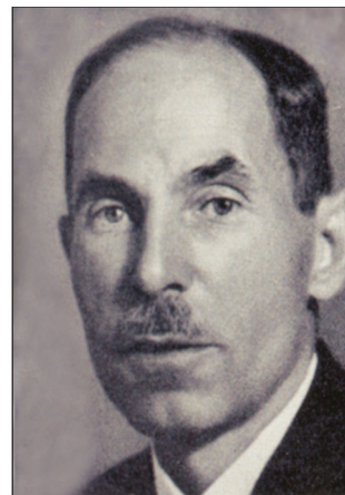
Латыш Янис Дикманис (1882–1969) был заместителем председателя UFEEES и членом МОК с 1926 по 1947 г. В предверии вторжения Красной армии он в 1944 г. бежал в Германию, оттуда в Англию, а затем в США. Слева: Поддержку Комитету оказывал также британец Тафтон Бимиш (1917–1989), с 1945 по 1974 г. член парламента от партии консерваторов, а затем барон Челвуд Люис в Восточном Сассексе