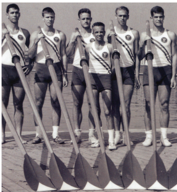
Для рулевого Роберта Зимоны (1918–2004) прошло шестнадцать лет между бронзовой медалью, завоеванной в составе венгерской двойки с рулевым в 1948 г., и золотой медалью, полученной в составе восьмерки с командой США в 1964 г. в Токио

Остается еще одно объяснение: правила, по-видимому, поставили МОК перед непреодолимым препятствием. Представляется,