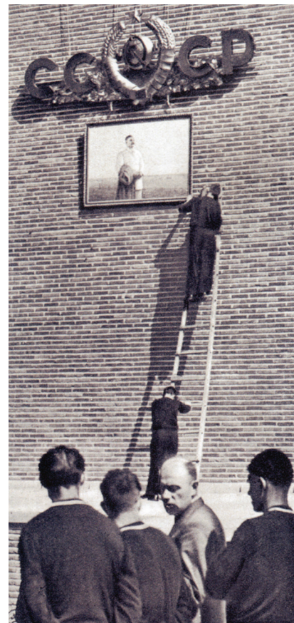
Олимпиада 1952 г. в Хельсинки стала свидетелем выхода на спортивную арену нового глобального игрока – Советского Союза. Команда СССР и другие сборные стран из-за «железного занавеса» разместились во второй Олимпийской деревне в Отаниemi. Их общение со спортсменами стран Запада было ограничено. Предполагалось, что картина, изображающая Сталина, «украсит» место размещения спортсменов