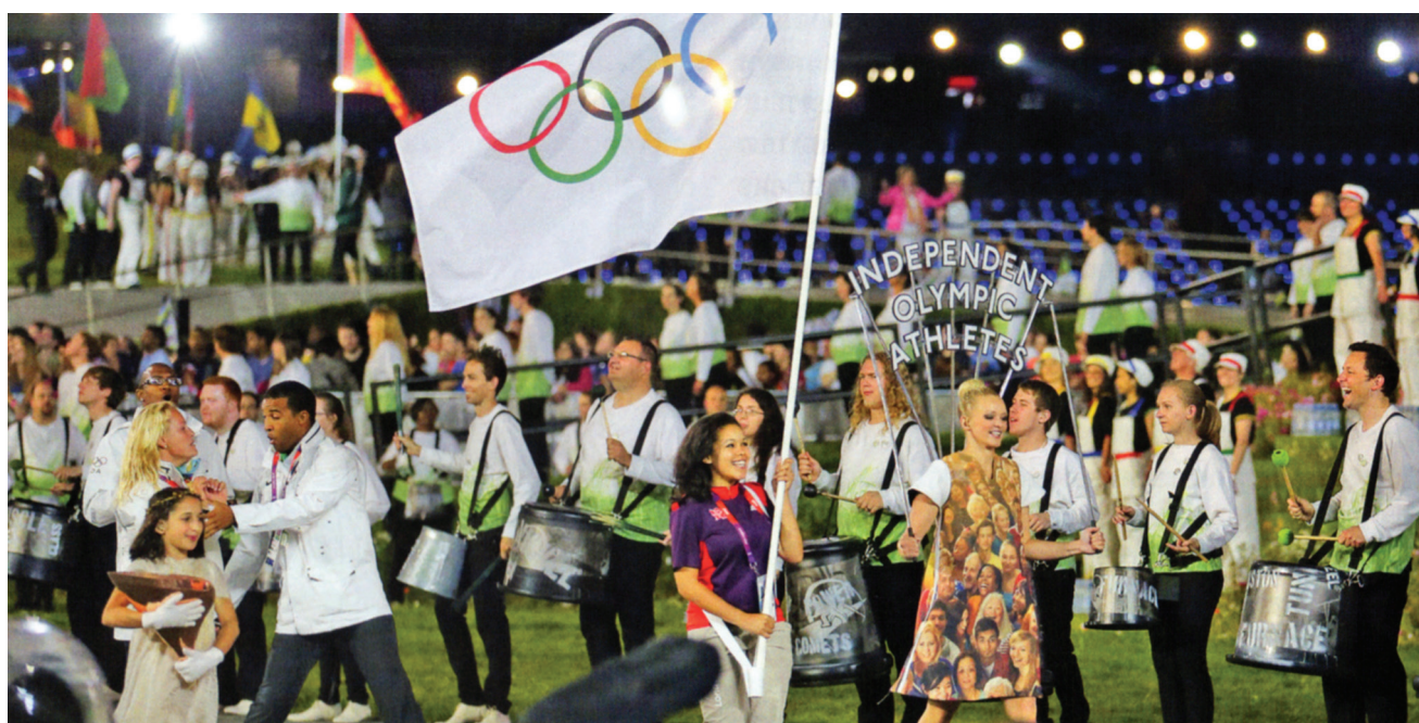
В 2012 г. в Лондоне под олимпийским флагом в качестве «независимых олимпийских спортсменов» выступали трое участников распущенного Национального олимпийского комитета Нидерландских Антильских островов, а также спортсмен из Южного Судана. Подобное решение было принято и в 1992 г. в отношении спортсменов из Сербии, Черногории и Македонии, а также в 2000 г. для четырех спортсменов из Восточного Тимора.

После отклонения просьбы о признании, UFEES постепенно перестал отправлять письма в МОК. В течение нескольких лет это объединение спортсменов, по-видимому, исчезло из поля зрения. Тем не менее проблема спортсменов-беженцев не «решилась сама собой», как предполагали лидеры олимпийского движения. МОК остается объектом публичной критики, иногда довольно резкой, за его подход к этому вопросу [36]. Хотя и медленно, эта организация начала переписывать свои правила и проявлять минимальный уровень гибкости. В 1956 г. члены UFEES проголосовали за то, чтобы позволить женщинам выступать за вторую по счету