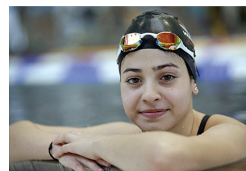
Сирийская пловчиха Юсра Мардини готовится в Берлине для участия в Олимпийских играх в Рио-де-Жанейро

Юсра Мардини: Сирия; представляет НОК Германии; плавание