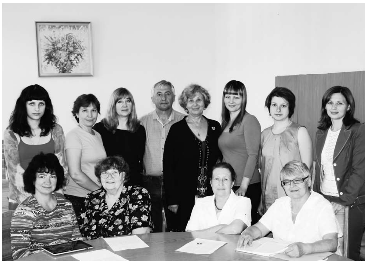
Учасники Круглого столу.

На мою думку, лише мирним шляхом, шляхом переговорів з місцевою людністю (за умови ізоляції терористів) можна вирішити цей конфлікт. Сподіваюся, що лише спеціальна програма, запропонована урядом, за умови її реалізації, дасть можливість не довести південно-східні та східні регіони України до катастрофи.