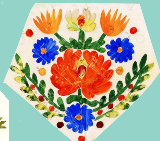
с. Острів. Є. Спаська. 1916 р.