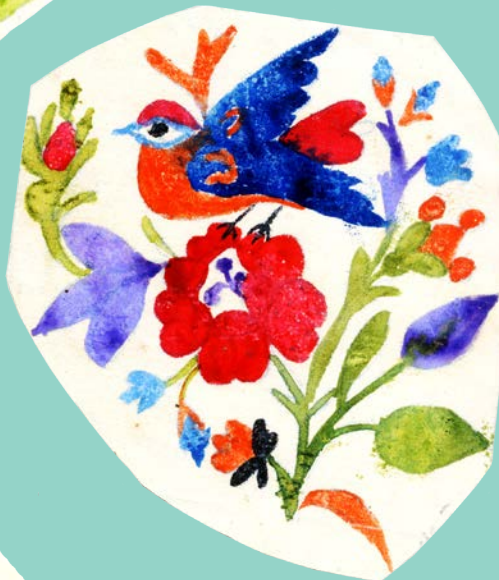
с. Острів. Д-р Фридман. 1916 р.