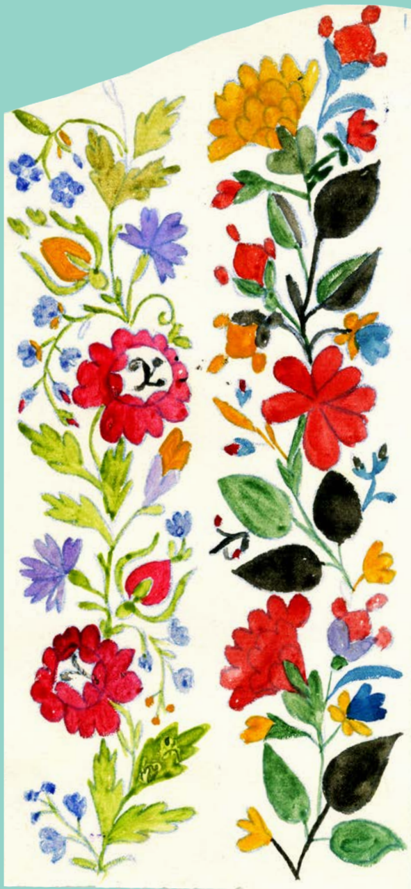
с. Острів. Д-р Фридман. 1916 р.