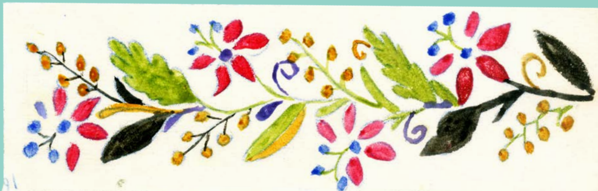
с. Острів. Д-р Фридман. 1916 р.