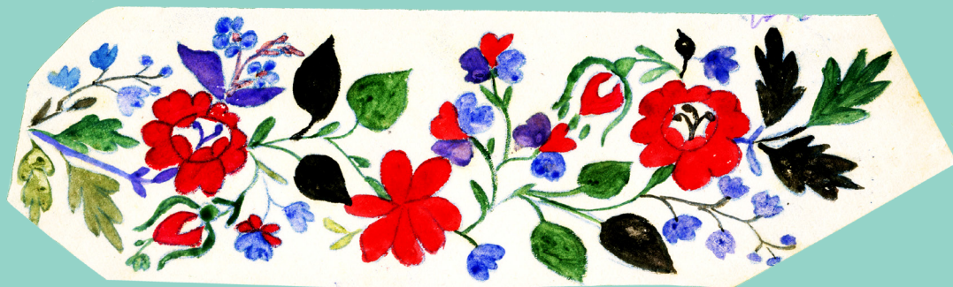
с. Острів. Д-р Фридман. 1916 р.