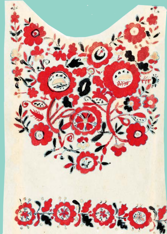
Манишка й комір чоловічої сорочки. Замалювала Є. Спаська у с. Буда Зборанська у переселенців із с. Глодова Золочівського повіту. 1916 р.