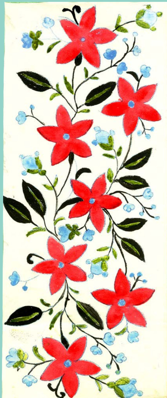
Частина узора з хустки. с. Острів. Д-р Фридман. 1916 р.