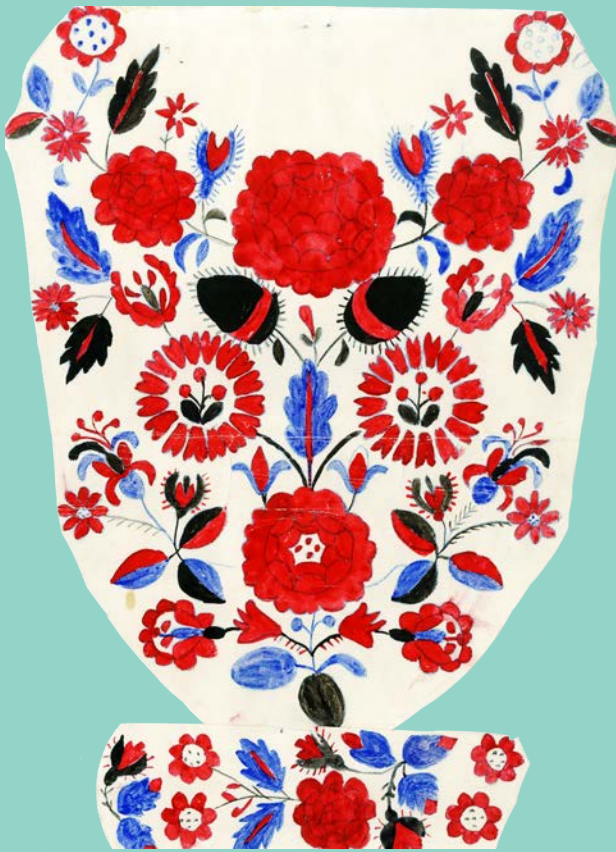
Манишка, комір і манжета чоловічої сорочки. с. Товстолуг. Д-р Фридман. 1916 р.