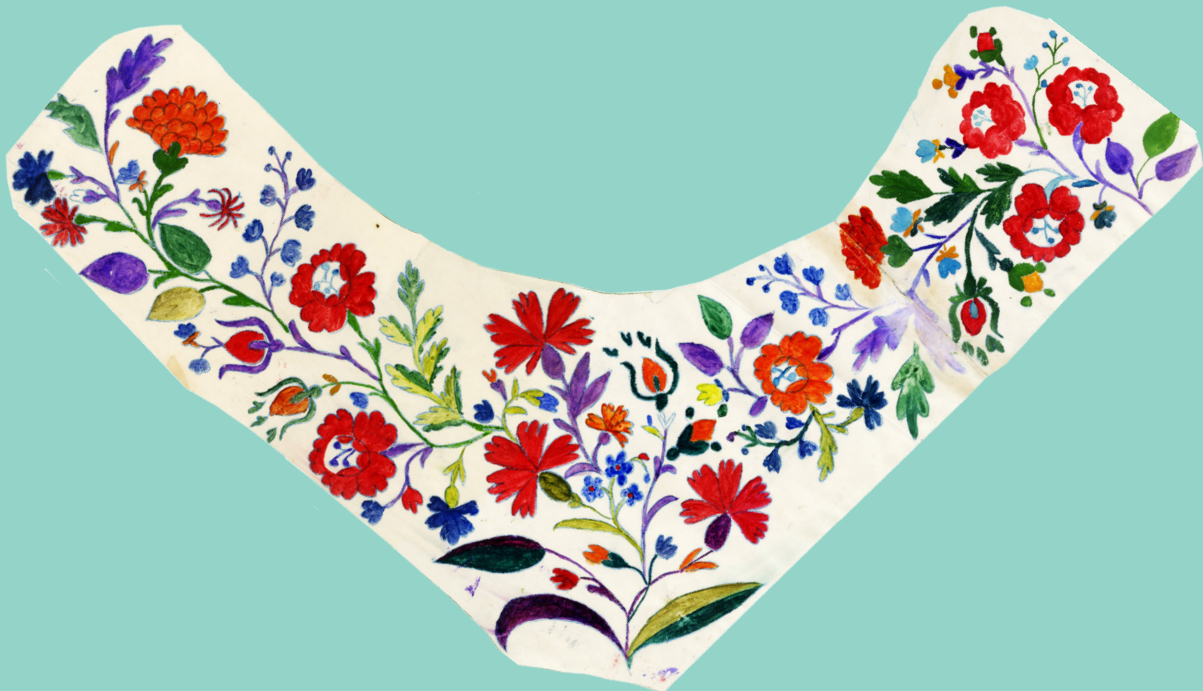
Половина узору фартуха. с. Острів. Д-р Фридман. 1916 р.