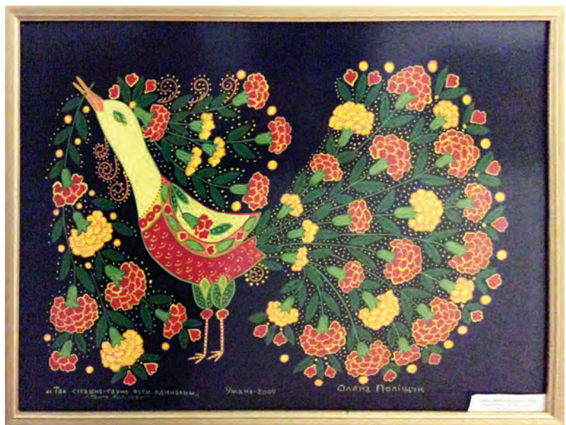
З експозиції Канівського музею народного декоративного мистецтва