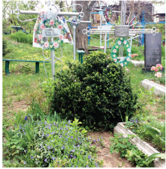
Старе кладовище на горі Божиця