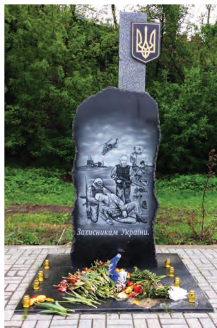
Пам'ятний знак захисникам України, що загинули в зоні АТО