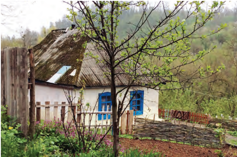
Житлові будинки. вул. Кобзарєва