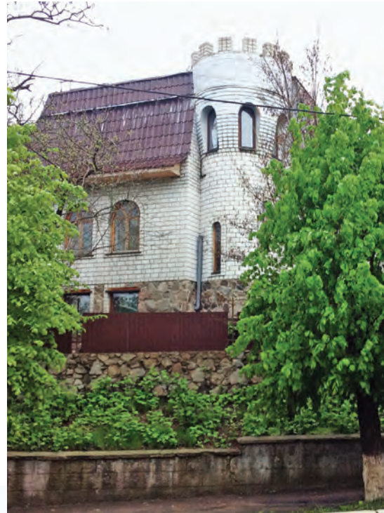
Сучасна забудова міста