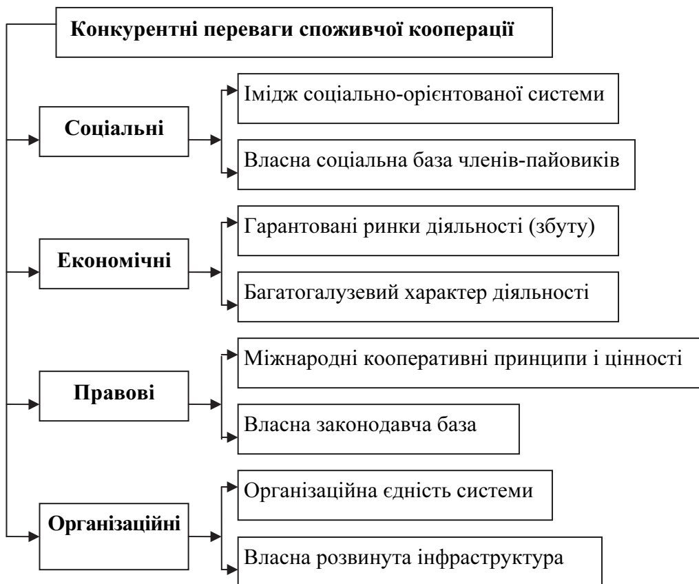
Рис. 1. Головні конкурентні переваги споживчої кооперації (узагальнено автором)

Унікальність споживчої кооперації полягає в тому, що, з одного боку, – це самоорганізована суспільна структура, а з іншого – самодостатня господарська організація. І саме ці особливості створюють конкурентні переваги, багатоаспектність яких є підґрунтям для довгострокового ефективного функціонування споживчої кооперації завдяки оптимальному поєднанню соціальної місії з її господарською діяльністю, заснованою на кооперативних принципах і цінностях (рис. 1).