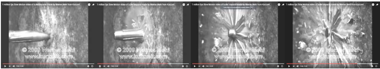
Рис. 1. Зіткнення свинцево-мідної кулі з бетонною перешкодою [20, 21]