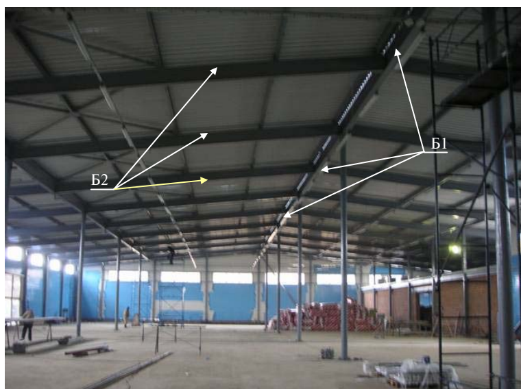
Рис. 1. Фото спорудження адміністративно-господарчої будівлі в м. Чернігів: Б1, Б2 – елементи МК, Б3 не показані

Балки Б1 та Б2 виконані з прокатного ФП типу двотавр № 45М з довжиною прогону 12000 мм. Висота від нульового рівня підлоги до верхньої полиці профілю балки Б1 становить 8350 мм. Балки Б2 розміщені на висотах 7150–8350 мм. Балки Б3 виконані з прокатного ФП типу швелер № 20П з довжиною прогону 6000 мм і розміщені на висотах 3450–4650 мм.