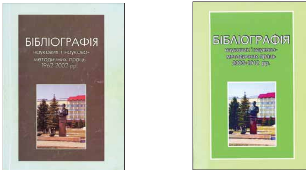
Рис. 3. Бібліографії, в яких наведені наукові, навчальні та навчально-методичні праці викладачів кафедри ботаніки за 1962—2002 і 2003—2012 рр.