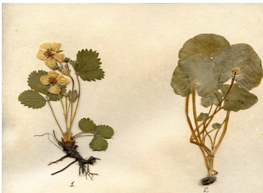
Рис. 2. Екологічні типи рослин по відношенні до світла: 1 - світлолюбі – суниця лісові ( Fragaria vesca L.); 2 - тіньовитривалі – пшінка весняна ( Ficaria verna L.)