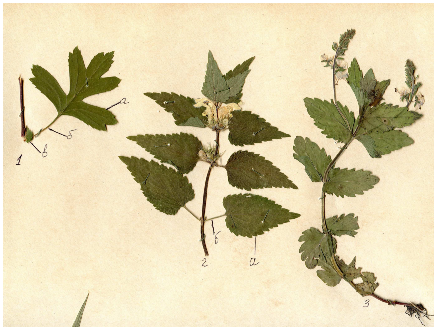
Рис. 3. Морфологічний гербарій. Будова листка 1. Черешковий листок повний – глід колючий ( Grataegus curvisepala Lindm.): а - листкова пластинка; б - черешок; в - прилистки. 2. Черешковий листок неповний – глуха кропива біла ( Lamium album L.): а - листкова пластинка; б - черешок. 3. Сидячий листок без піхви – вероніка дібровна ( Veronica chamaedrys L.)

З використанням гербарних матеріалів, відповідно за навчальними планами, викладачами кафедри проводяться лекції та лабораторно-практичні заняття з біологічних дисциплін, спецкурси та навчально-польові практики. Ознайомлення студентів, майбутніх учителів природничих дисциплін, з гербарним матеріалом відбувається ще на першому-другому курсах під час вивчення навчальних дисциплін ботаніки (анатомії та морфології рослин) і систематики рослин, які передбачають поглиблення знань, вмій і навичок, набутих у процесі навчання.