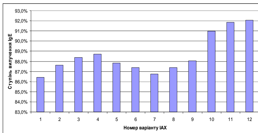
Рис. 2. Ступені вилучення ІgЕ людини із розчину при різних варіантах ІАХ

Отримані результати свідчать про доволі високий рівень вилучення цільового імуноглобуліну із сироватки крові людини. Разом із тим, при використанні МАТ 164Н10 було отримано дещо кращі результати, ніж у аналогічних дослідах із використанням МАТ 163D12. За досліджуваних умов ІАК на основі ТЕОС також засвідчували дещо вищі ступені вилучення ІgЕ. Слід також зазначити, що при проведенні даних експериментів нами було помічено, що об'єм кожного різновиду елюату, необхідний для повної елюції сорбованого імуноглобуліну, відрізняється один від одного; у випадку використання ЦФР для цього навіть потрібно 2 цикли. Отже, більш прийнятними для використання як елюент себе зарекомендували розчини 8М сечовини та 4М MgCl_2 \times 6H_2O . Використання ж ЦФР не було доцільним через необхідність проведення декількох етапів елюції сорбованого імуноглобуліну.