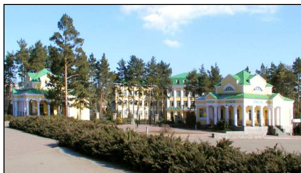
Рис. 5. Новозбудована вхідна зона з вул. Київська (1996 р.)