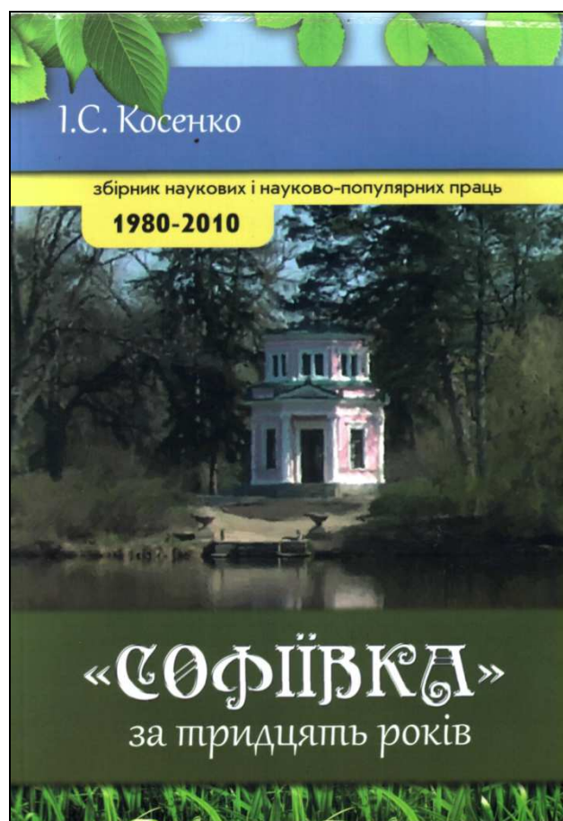
Рис. 6. Обкладинка і сканована копія частини стор. 14 з книжки — «Софіївка» за тридцять років (1980–2010)