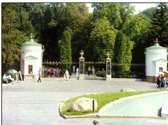
Рис. 3. Відновлений Головний вхід (серпень 1980 року)