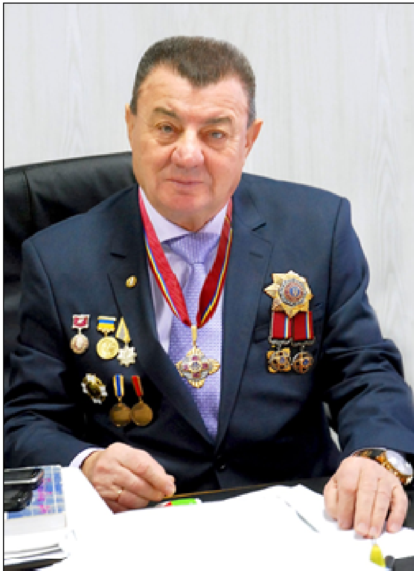
ПРОФЕСОР ІВАН СЕМЕНОВИЧ КОСЕНКО

(до 75-річчя від дня народження члена-кореспондента НАН України, професора І. В. Косенка)