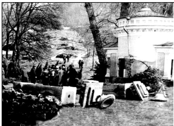
Рис. 1. Зруйнований Головний вхід (квітень 1980 року)