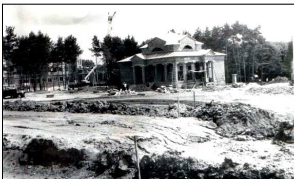
Рис. 4. Будівництво вхідної зони з вул. Київська у розпалі (початок 90-років)