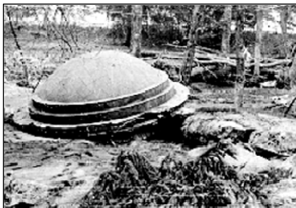
Рис. 2. Рештки Фазанника віднесені повинню до Критського лабіринту (квітень 1980 року)