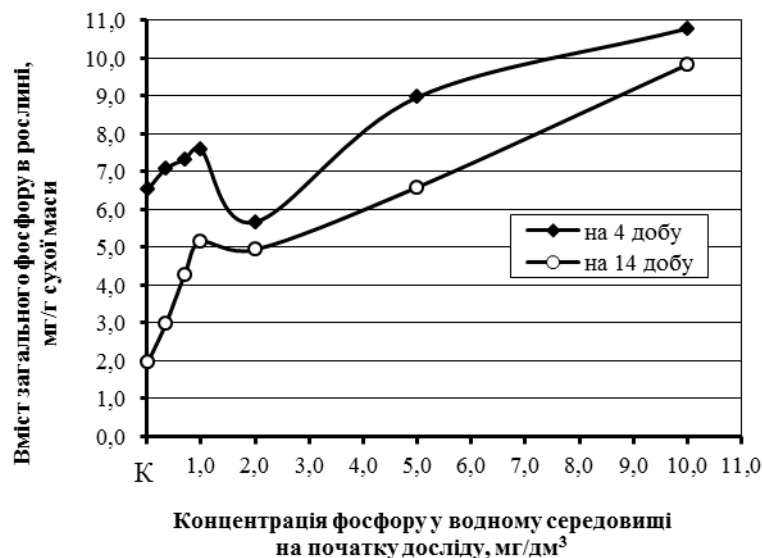
Рис. 1. Динаміка вмісту загального фосфору в N. guadelupensis за різної початкової концентрації фосфору в модельному водному середовищі.

Вивчення впливу концентрації фосфатів у модельному водному середовищі на поглинання фосфору різною дозволило виявити деякі особливості. Так, зокрема, в гострих дослідах через 4 доби експозиції відзначалося збільшення вмісту загального фосфору на 1 г с. м. рослини зі зростанням концентрації фосфору у воді від 0,03(К) до 1,0 \text{мг/дм}^3 , уповільнення його поглинання в інтервалі концентрацій від 1,0 до 2,0 \text{мг/дм}^3 , і подальша активація цього процесу при концентраціях вище 2,0 \text{мг/дм}^3 . Отже, залежність інтенсивності споживання фосфору різною від його концентрації у водному середовищі мала фазовий характер з чергуванням періодів зростання, спаду і знову зростання (рис. 1).