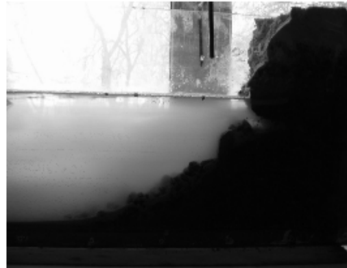
Рис. 1. Схема гідроізоляції бортів соляного кар'єру в процесі затоплення (вгорі) відтворена при експериментальному моделюванні (внизу)

В наступному експерименті в процесі дослідного затоплення до рівня "четвертинного горизонту" проведені спостереження за змінами хімічного складу вод при періодичному відборі 25% об'єму розсолів з дна. У такий спосіб моделювався процес гравітаційної диференціації розсолів, що утворюються у ніші вилуговування та поширюються вниз по ухилу борта у відповідності до питомої маси. Відібраний об'єм розсолу компенсувався додаванням тотожної кількості прісної води у ламінарному та турбулентному режимах. Після 3-5 денного відстоювання в "затопленому кар'єрі" визначали питому масу води ареометричним методом з п'яти водних прошарків на рівні: 1 – "водної поверхні", 2 – "четвертинного водоносного горизонту", 3 – "гіпсово-глинистої шапки", 4 – "соленої товщі" та 5 – "донної частини кар'єру". Як показують спостереження на моделі, розсіл з високою мінералізацією стікає нахиленою поверхнею ніш на дно, а прісна вода накопичується зверху. В такий спосіб доведено чітку гравітаційну диференціацію та приуроченість розсолів близьких до насичення до донної частини експериментальної водойми. Мінералізовані води різної концентрації від вищих внизу до нижчих вгорі локалізовані у центральній частині поперечного профілю моделі. Натомість у приповерхневій частині водної товщі при мінімально-спостережуваних процесах змішування в умовах відсутності вітрового впливу локалізовані прісні води.