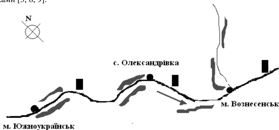
Рис. 1. Картографічна схема р. Південний Буг: ■ – місця відбору проб

Визначення мікроскопічних водоростей проводили за європейськими та українськими визначниками [3, 8, 9].