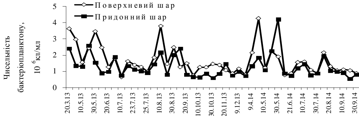
Рис. 1. Динаміка чисельності бактеріопланктону в поверхневих і придонних водах моря біля острова Зміїний в 2013–2014 рр.

До евтрофних вод, які за ступенем чистоти є слабо забруднені відносилося лише 11% проб з поверхневого і 4% проб з придонного шару. Середня чисельність бактеріопланктону поверхневих вод у 2013 і 2014 рр. складала 1,71 \pm 0,87 \cdot 10^6 і 1,54 \pm 0,86 \cdot 10^6 кл/мл, відповідно, та відносилися до мезотрофних вод, які за ступенем якості належать до категорії “досить чисті”. В придонному шарі чисельність бактеріопланктону була декілька меншою ніж на поверхні і складала 1,26 \pm 0,60 \cdot 10^6 у 2013 р. і 1,34 \pm 0,87 \cdot 10^6 кл/мл у 2014 р., що відповідало мезотрофним водам (по якості – к категорії “чисті”). За чисельністю бактеріопланктону в загалом для всієї водної товщі останні два роки були практично однаковими ( 1,48 \pm 0,78 \cdot 10^6 кл/мл у 2013 та 1,44 \pm 0,86 \cdot 10^6 кл/мл у 2014 рр.) і характеризувалися категорією чисті та мезотрофним статусом. Аналіз сезонної динаміки бактеріопланктону показав, що упродовж вегетаційного періоду 2013 р. середньомісячні значення чисельності бактерій змінювалися від найвищих у квітні ( 2,97 \cdot 10^6 кл/мл) та серпні ( 2,58 \cdot 10^6 кл/мл) до найменших ( 0,98 \cdot 10^6 кл/мл) у грудні. Відповідно цьому якість вод змінювалася від категорії слабо забруднені до категорії “чисті прибережні воді” (рис. 2). В обидва роки спостерігалися типові сезонні зміни чисельності бактеріопланктону [2], які характеризувалися максимумами навесні та в серпні з поступовим зменшенням восени.