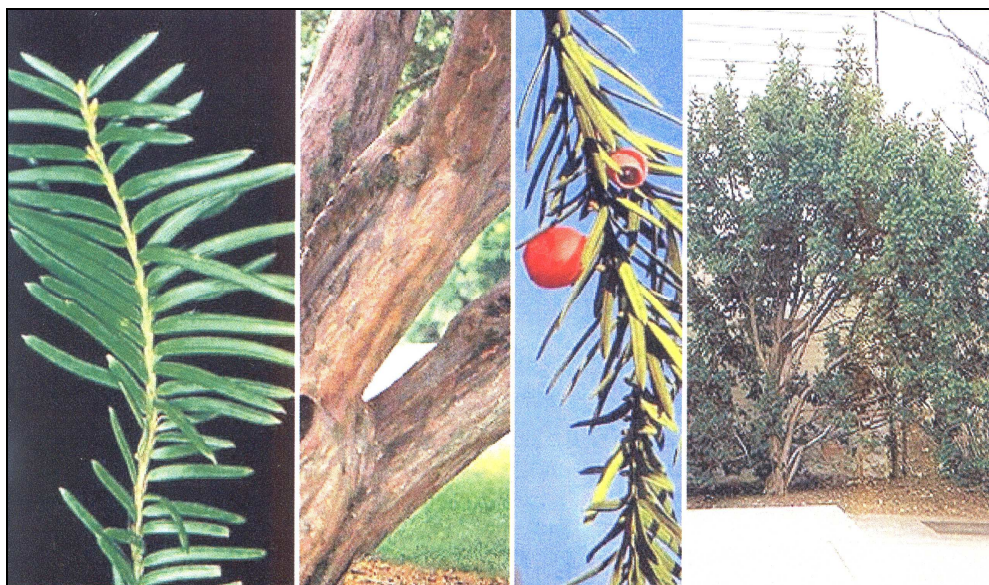
Основні морфологічні ознаки Taxus baccata L.