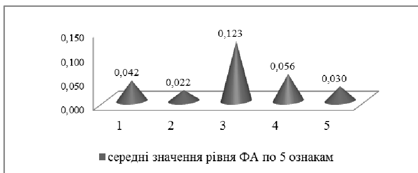
Рис. 1. Шкала чутливості асиметрії морфологічних ознак листової пластинки Betula pendula до стресового впливу в насадженнях м. Кривий Ріг

За ступенем збільшення порушення симетрії ознаки утворили наступну послідовність: 2>5>1>4>3.