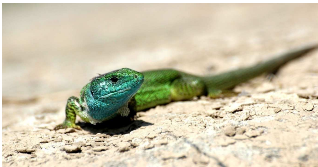
Фото. Ящірка зелена, ок. с. Добрівляни, Заліщицького р-ну, відкритий схил р. Дністер. 24.04.2018 р.

У результаті проведених досліджень встановлено, що в типових біотопах (лісові галявини, узлісся, схили річкових долин) L. viridis є найбільш чисельним видом плазунів. Найвищу чисельність популяцій ящірки зеленої виявлено на південних схилах р. Дністер.