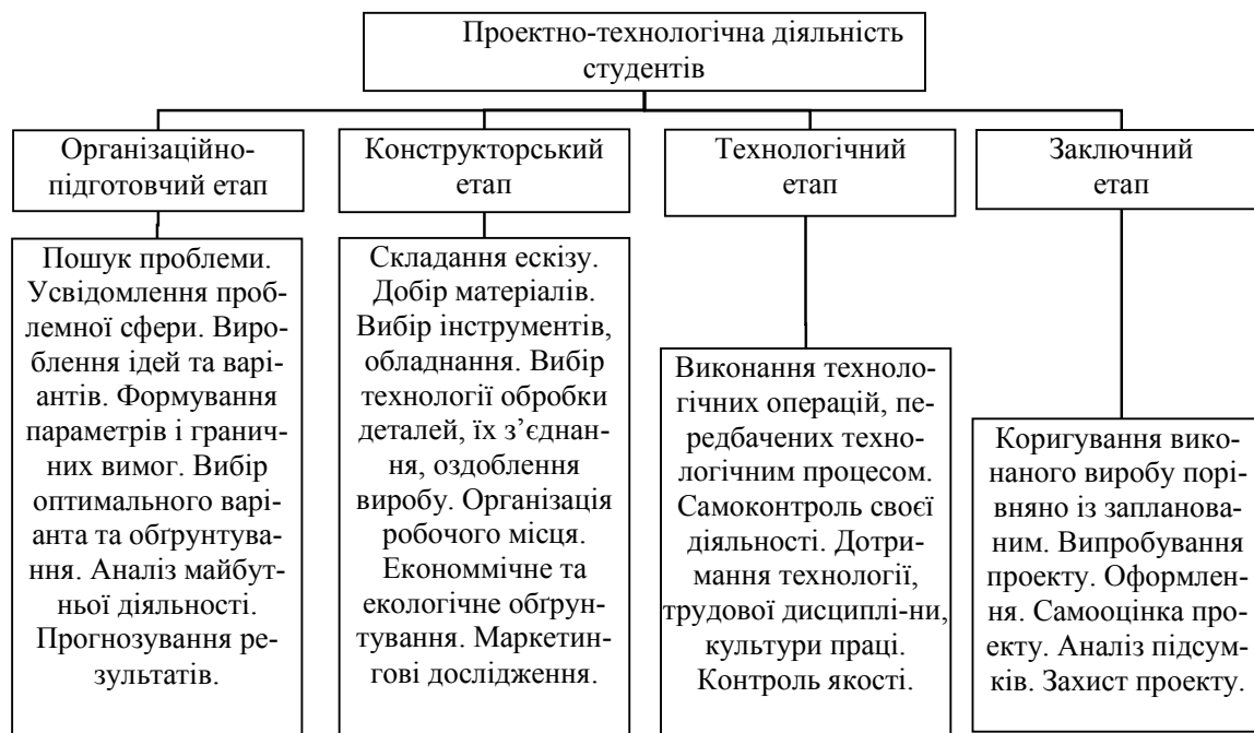
Рис. 1. Модель проектно-технологічної діяльності студентів.

На цій структурній основі можна побудувати модель проектно-технологічної діяльності (див. рис. 1). Проектування як елемент проектно-технологічної діяльності має свої етапи та стадії його виконання.