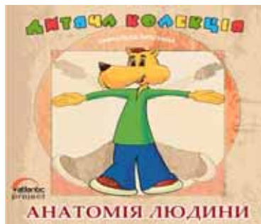
Рис. 3. Електронний посібник «Анатомія людини»

Електронний атлас — альбом зображень різних об'єктів (карти, креслення, малюнки тощо), представлених в електронному вигляді з відповідними засобами навігації, пошуку. Зокрема, інформаційно-картографічна електронна система «Україна та її регіони» (рис. 4) подає інформацію про Україну, її регіони та окремі міста.