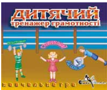
Рис. 1. Мультимедіа-тренажер «Дитячий тренажер грамотності»

Перевагою використання у практиці початкового навчання мультимедіа-тренажерів для відпрацювання учнями способів навчальних дій є різноманітність варіантів ігрових навчальних завдань; приваблива, виразна форма подання матеріалу; наявність різних форм заохочення та надання мультимедіа ресурсом своєчасної допомоги, що забезпечує діяльнісний підхід молодших школярів до засвоєння і закріплення знань. Наприклад, «Дитячий тренажер грамотності» (видавець «Сорока Білобока») — навчальна гра для школярів початкових класів. Текстові, словникові та малюнкові тренажери допомагають значно підвищити рівень знань молодшого школяра з української граматики (рис. 1), закріпити знання українського алфавіту, а також удосконалити граматичні навички.