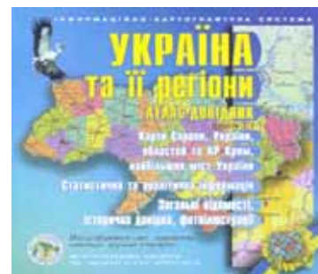
Рис. 4. Електронний атлас України «Україна та її регіони»

Перевага використання електронного атласу України полягає в тому, що труднощі, які можуть виникнути у вчителя при підготовки до демонстрування школярам навчального матеріалу (створення плакатів, збільшення фотографій, підготовка символічного матеріалу, різноманітних пам'яток та ін.), можуть бути легко усунені за рахунок наявності в електронному ресурсі 36 тематичних карт України, які відображають її географічне положення, унаочнюють природу та ресурси країни, довкілля тощо. Крім того, 50 карт регіонів України, 250 фотоілюстрацій, загальні та історичні відомості тощо [5] забезпечують оперативний доступ до інформації, яка може бути легко продемонстрована на інтерактивній дошці або на спеціальному екрані за допомогою мультимедійного проектора, роздрукована на кольоровому принтері для використання як роздавальний матеріал.