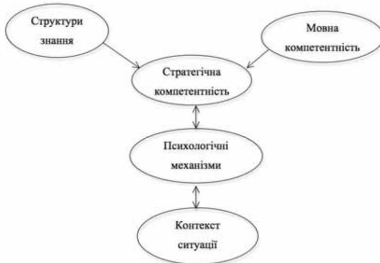
Рис. 1. Компоненти комунікативної мовної здатності у комунікативному вживанні мови (за [2]).

Л. Бахман описує мовну комунікативну здатність (communicative language ability) як складову знань чи компетентності та здатність до виконання чи запровадження цієї компетентності у відповідне контекстуалізоване комунікативне мовне вживання (communicative language use), що складається із трьох компонентів: мовної компетентності, СтК та психологічних механізмів [2, с. 84–107].