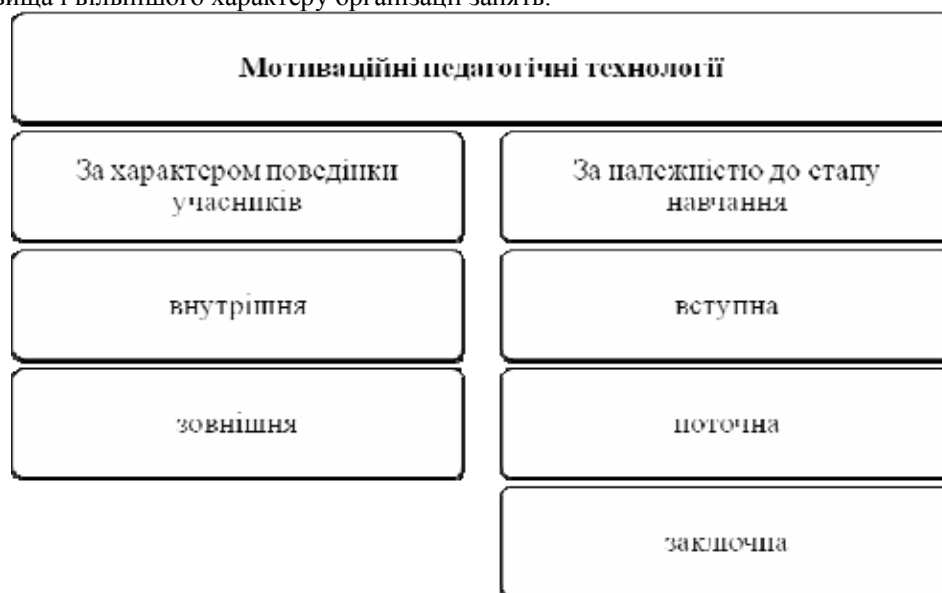
Рис. 1. Класифікація навчальної мотивації.

Проте найбільш цікавими, на нашу думку, є дослідження О. Юпітова і А. Зотова [17], щодо ситуації професійного самовизначення студентів. Враховуючи дані цих авторів, зазначимо, що студенти I–II курсів відчувають тривогу стосовно нового незвичного середовища і вільнішого характеру організації занять.