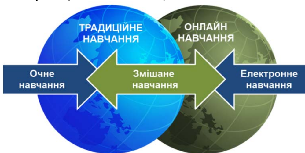
Рис. 1. Структура змішаного навчання.

Визначені компоненти функціонують у постійному взаємозв'язку, утворюючи єдине ціле. Отже, змішане навчання – це система, складові якої гармонійно взаємодіють за умови грамотної методичної організації.