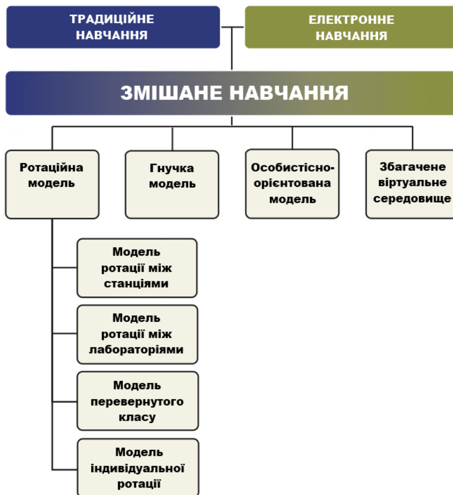
Рис. 3. Моделі системи змішаного навчання.

Успішність реалізації методики змішаного навчання досягається вибором оптимальної моделі, а також створенням відповідного освітнім цілям навчального середовища, що задовольняє наступні вимоги: