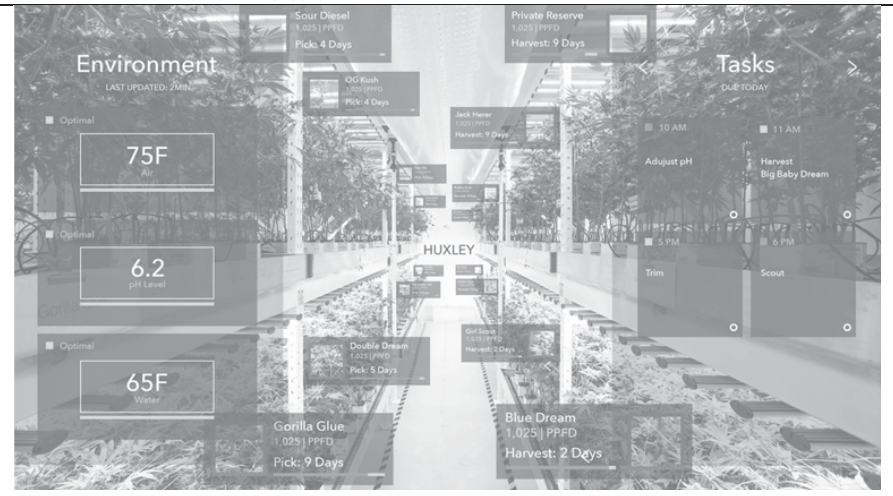
Рис. 2. Приклад роботи додатка «plant vision»

Цей додаток покликаний допомогти малим фермерським господарствам, в яких суттєво відчувається брак фахівців з агрономії, а в переважній більшості випадків такі господарства просто не можуть фінансово собі дозволити такого фахівця.