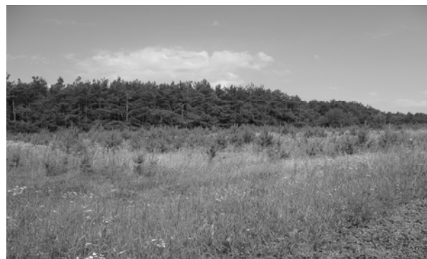
Фото 1. Експансія соснового лісу на пн.сх. околицях с. Дітківці

На північно-східній околиці Дітківця вершинна поверхня товтрового пасма вкрита садженим сосновим лісом, до якого прилягає кілька гектарів перелогу. На останньому спостерігається активне заростання самосівом сосни