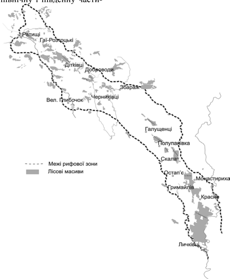
Рис. 1. Схема сучасного розміщення лісових масивів в Товтрах і на прилеглих територіях

Ліси південної частини Медоборів за В. Шафером – це ліси середньоевропейського типу. На початок ХХ ст. деревостанів старшого віку і первинного типу у них практично не залишилось. В. Бондаренко зі співавторами [2] на основі аналізу робіт А. Вежейського та В. Шафера відзначають, що значне поширення в Подільських дібровах граба стало наслідком протегування йому при веденні лісового господарства як швидко-ростучій і невибагливій породі.