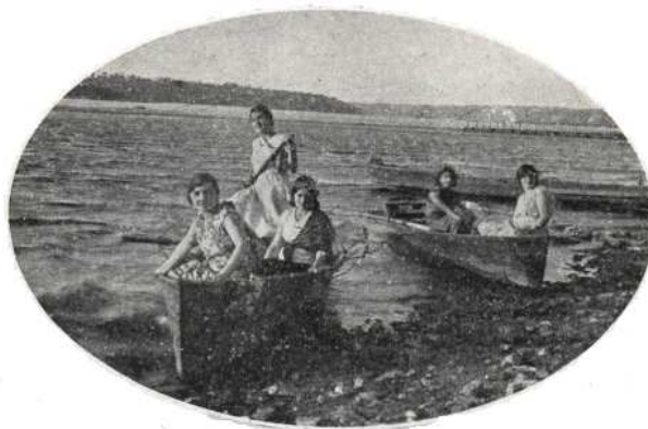
Рис. 1. Відпочивальники на пляжі “Сонячний” та біля човнової станції Т-ва веслувальників