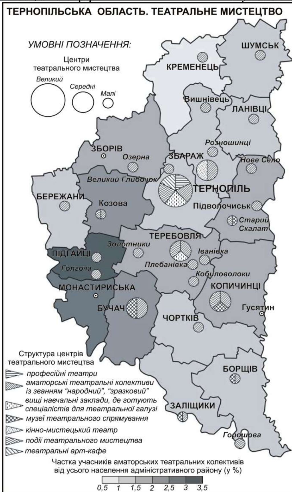
Рис. 3. Театральне мистецтво Тернопільської області

ний "вертеп". З туристичною метою активно відбувається становлення театральної кінно-