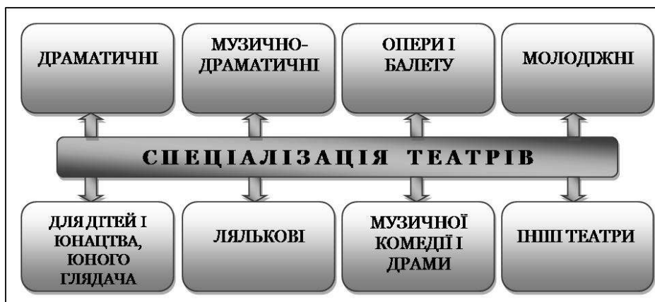
Рис. 1. Функціональна спеціалізація професійних театрів

Сьогодні формування і функціонування театрально-мистецької мережі регіону залежить від цілої низки факторів, серед найбільш вагомих варто назвати такі: