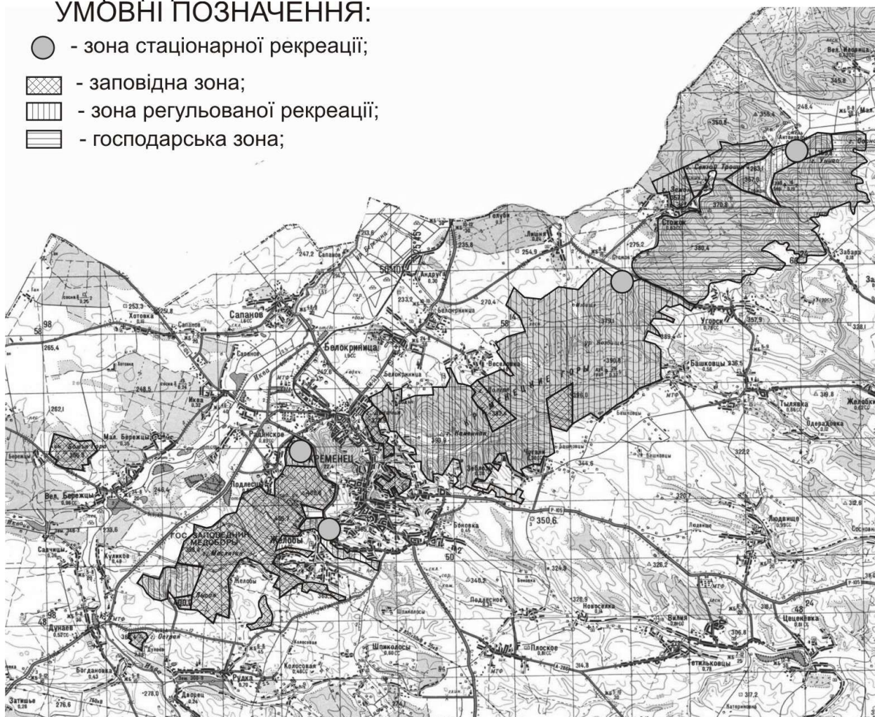
Рис. 3. Функціональне зонування НПП "Кременецькі гори".