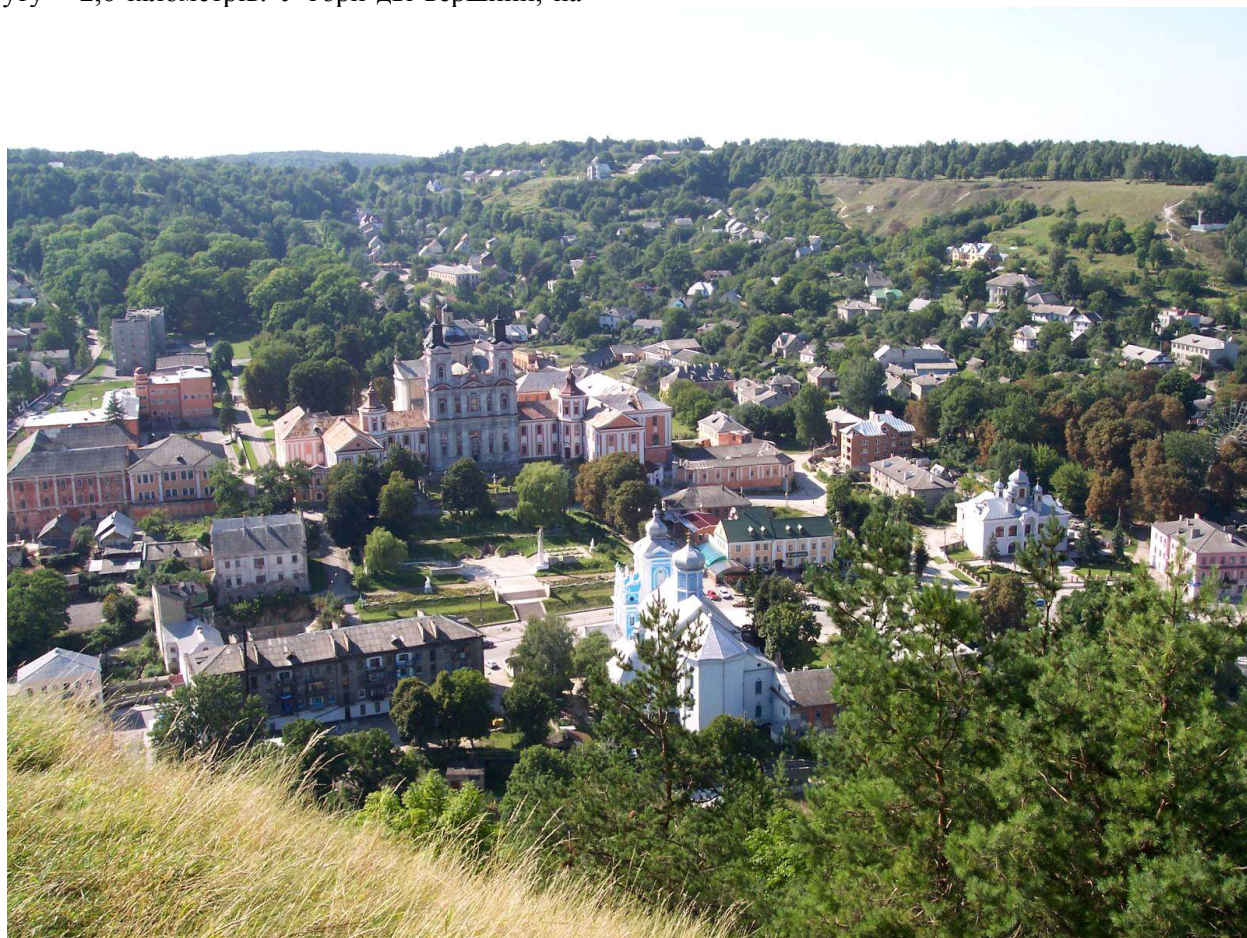
Рис. 2. Вид на Кременець із гори "Бона"

Вона ще з княжих часів, з IX-X ст., була місцем подвижництва численних монахів. Гора Божа відома серед прочан завдяки місцю, що зветься "Ступня Матері Божої". Тут знаходиться новозбудована капличка, "печера Монаха" та кількасотлітнє цілюще джерело. Заступництва Богородиці, духовного та фізичного зцілення у цих місцях шукають віряни з усього світу. Часто вони йдуть до неї пішки за сотні кілометрів, щоб почерпнути тут цілющої духовної сили. До речі, свого часу серед прочан тут були Леся Українка з Климентом Квіткою, українські послы до польського сейму С.Скрипник, М.Тележинський, письменник У.Самчук. Кількість відвідувачів за сезон складає більше 20 тис. осіб.