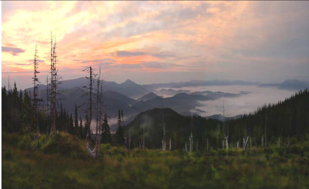
Світлина 2. Усихання смерекового деревостану у приполонинській зоні.

Тим самим, спостерігається значна просторова деградація приполонинських смерекових лісів внаслідок їх природного усихання. Велика ймовірність, що причиною є глобальне потепління, яке проявилось в даній зоні у вигляді різкого зменшення атмосферних опадів.