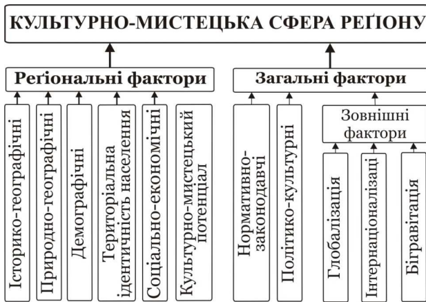
Рис.1. Фактори формування, функціонування і розвитку культурно-мистецької сфери регіону

нормативно-законодавчі, політико-культурні; за рівнем впливу – глобальні, національні, регіональні, локальні і персональні; за часом дії – постійні, тимчасові, ситуативні; за результатом впливу – конструктивні і деструктивні.