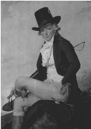
Іл.3. Жак-Луї Давид. Портрет П'єра Серизіа. 1795. Лувр, Париж