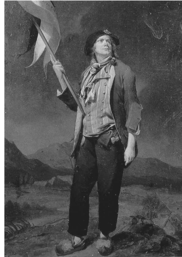
Іл. 2. Луї Леопольд Бойль. Портрет актора Шенара в костюмі санкюлота. 1792. Музей Канавале. Париж