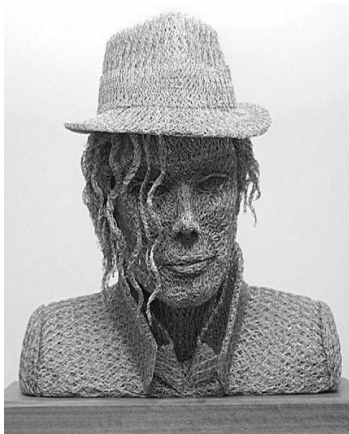
Рис.1. Скульптура Майкла Джексона. Іван Ловатт.

Причому Парк Чен-гел створює як оригінальні скульптури, автором ідеї і візуальної реалізації яких він є, так і копіює у власній манері вже існуючі відомі твори (Рис. 3). Це, наприклад, скульптура Аполлона чи фігура всесвітньовідомої Венери.