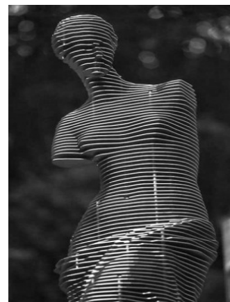
Рис.3. Нарізна металева скульптура «Венера». Парк Чен-гел.

Таким чином, скульптор, працюючи в галузі декоративної пластики, використовує зовсім новий підхід до природи речей, перетворюючи старий метал на блискучі (у прямому і переносному сенсі) скульптури, які можуть доповнити собою художній образ та зміст сучасного урбаністичного середовища.