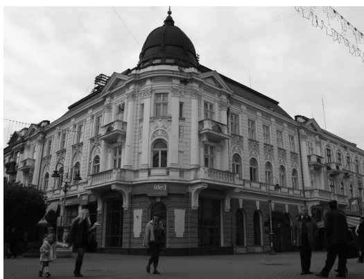
Історизм. кінець XIX ст. вул. Незалежності, 21.

Велика частина архітектурного фонду Івано-Франківська постраждала внаслідок пожежі 1868 року. Вогняна стихія зруйнувала четверту частину міста [1, с. 37-38]. Можливо тому будівель у стилі бароко, класицизм зустріти тяжко, проте маємо форми і деталі у спорудах пізнішого періоду (необароко, неоренесансу, неокласицизму).