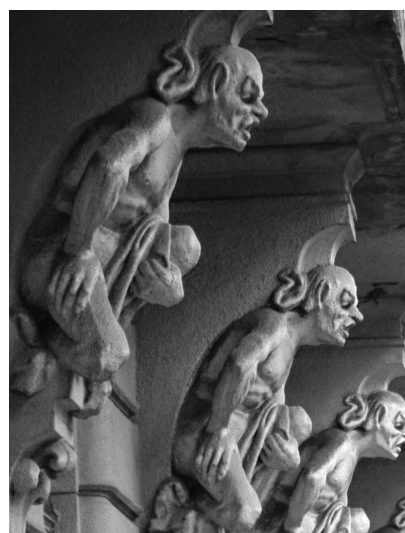
Об'ємна скульптура (химери) скульптор М. Бринський. Фрагмент фасаду будинку по вул. Шевченка, 44.