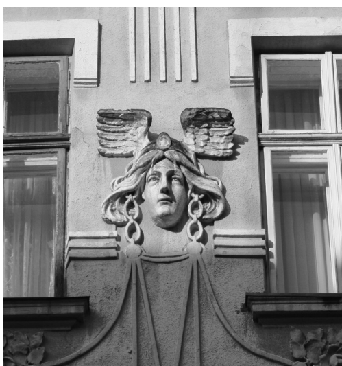
Декоративна сецесійна пластика (маскарон) будівля 1906 р. Фрагмент фасаду будинку по вул. Леся Курбаса, 5-9.

Сецесійний декор також має певну своєрідність. Багатою декоративною пластикою відзначається будівля по вул. Академіка Гнатюка, 2. Стильове звучання тут виражене через композицію із медальйонів і стилізованих квітів – ромашок. Вони підкреслюють пілястри будинку і напружені вигини кронштейнів. Ця споруда належить до орнаментальної сецесії (раннього періоду розвитку стилю). Прикладом зрілої модерної стилістики в архітектурному середовищі є музей визвольних змагань Прикарпатського краю по вулиці Тарнавського, 22. Оформлення віконного прорізу цієї споруди нагадує форму великої літери грецького алфавіту – омега (Ω). Цікавим художнім вирішенням відзначаються житлові будинки по вулиці Незалежності, 16, 18, і 30 [6, с.15]. Для модерної стилістики характерна багата декоративна пластика: об'ємні скульптури, ліпнина. Сецесійні маскарони переважно виражені через жіночий портрет зі стилізованим розвіяним волоссям. Зустрічаються на вулицях: Гординського, 4, Грушевського, 37, Шевченка, 69 тощо. Об'ємні форми представлені химерами (вул. Шевченка, 44), також можна виявити жіночі фігури, одягнені у легкі драпіровані тканини, подібні до античного костюма (вул. Тарнавського, 22), та чоловічі постаті – атланти (вул. Грушевського, 42, Незалежності, 30).