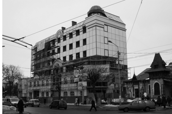
Постмодернізм. Адміністративний будинок. 2011 р. Вул. Василянок, 22.

У 1990-х роках інтерес до народностильового напрямку дещо знижується. Відбуваються пошуки введення трансформованих елементів народностильової архітектури в постмодернізм. Це проявляється у застосуванні романтичних башточок, у складних конфігураціях стрімкого даху в житловій багатоповерховій забудові. Характерним прикладом може служити новий мікрорайон по вул. Пилипа Орлика в Івано-Франківську [7, с. 41].