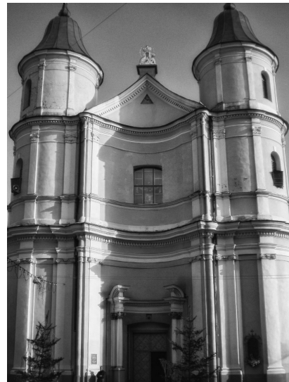
Бароко. Покровський кафедральний собор (друга пол. XVIII століття) вул. Вірменська, 6.

Найстарішими пам'ятками міста є фортечний провулок і Парафіяльний костел Пресвятої Діви Марії, що на площі Шептицького, 8. Сьогодні останній використовується як виставковий зал і мистецький центр, відомий уже більше за назвою «Художній музей». Парафіяльний костел відігравав роль однієї з міських доміант посеред житлових кварталів й оборонного укріплення міста. Це вияв барокового устрою з елементами Ренесансу. У композиції переважають вертикальні членування пілястрами доричного ордеру (останній ярус