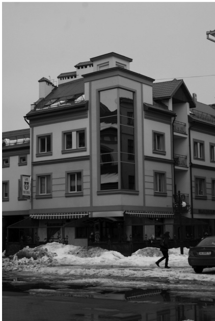
Постмодернізм. Адміністративний будинок. 90-і роки. Вул. Галицька, 31.

Новітня забудова Івано-Франківська кінця ХХ – початку ХХІ ст. набуває форм одного із провідних стилів для цього часу – постмодернізму. Зародження цього напрямку відбулося у 60–70-х роках у США, згодом він поширився на Європу. Постмодернізм проникає в усі галузі культури. Його характерна філософська концепція з успіхом прийнята світом передусім тому, що працює як відгомін минулої класики жанру, проте обов'язково разом із жартом, іронією, наче промовляє своєрідними зашифрованими посланнями. Архітектор Р. Стерн назвав «три засади архітектури постмодернізму: контекстуалізм – окрема споруда як фрагмент більшого цілого; алізіонізм – архітектура як історичне і культурне відлуння; орнаменталізм – стіна як середовище архітектурного значення» [4, с. 31]. У цьому і є новаторство стилю, а також те, що спонукає до небайдужості до нього.