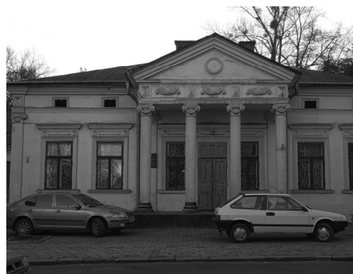
Історизм. кінець XIX ст. вул. Січових стрільців, 8.

У будівлях центральної частини міста домінують стилі «сецесія» та «історизм». Період історизму передбачав відхід від строгого дотримання класичного ордеру до більш вільного застосування архітектурних прикрас. Масштаб елементів оздоблення дрібнішає, нівелюється різниця між декорованим тлом і пишно декорованою деталлю. Площина фасадної стіни може заповнюватися рустами, цегляним та кам'яним муруванням або їх імітацією [2, с. 143]. Цікавим прикладом неокласицизму, поєднаного з об'ємною структурою модерну, є колишній кінотеатр «Тон» по вул. Грушевського, 3. У дусі еkleктичної стилістики вирішені будівлі по вул. Івана Мазепи, 14, адміністративна будівля Ради спілок на площі Адама Міцкевича, 4, житлова забудова з об'єктами обслуговування (книжковий магазин «Букініст») по вул. Незалежності, 19 та інші. Поєднання рис класицизму і ренесансу можна побачити на будівлі по вул. Незалежності, 21.