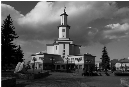
Ар деко. Ратуша 1935р. Архітектор С. Треля. Пл. Ринок.

Ще одним виразним прикладом архітектурного твору Ф. Януша є будинок по вул. Незалежності, 11. Підкреслена кубічність граней архітектурних форм, балкончики, декоровані простими лінейними вертикально розташованими металевими стрижнями решітки, стилістично підтримують художнє звучання будівлі. Декоративними акцентами на фасаді виступають скульптури хлопчиків на 2-му поверсі і чоловіча і жіноча постаті – на верхньому. Будинок наріжний, тому його кутова частина заокруглена, раніше продовжувалася у невеличку башточку з напівсферичним куполом (сьогодні ці елементи відсутні). Пізнішим зразком такої стилістики є остання міська ратуша, запроектована архітектором С. Трелею. Вона виконана у стилі ар деко: каркасна конструкція будинку-вежі поєднується з традицією використання декоративних форм зі стилізованими неокласичними елементами.