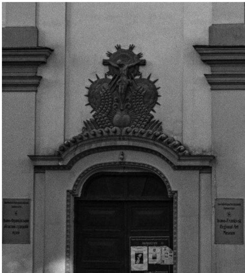
Картуш. Парафіяльний костел Пресвятої Діви Марії. Пл. Шептицького, 8.

Система декору будівель включає в себе архітектурні обломи, орнаментальні й геральдичні мотиви, емблематику, скульптурну пластику тощо. Конструктивні елементи будинку за своїм художньо-образним вирішенням теж безпосередньо асоціюються з окремими стилями. Наприклад, шпильчасті вежі і стрільчасті арки пов'язані з готичним устроєм; трикутний портик, циліндричне склепіння, купольні конструкції, аркада, встановлена на колонах, – Ренесансним; щипець, обрамлений волютами, характерний для бароко; горизонтальне членування фасадної стіни і класичний ордер властиві класицизму; асиметрія фасаду і видовжені форми криволінійних віконних і дверних прорізів притаманні стилістиці модерну тощо.