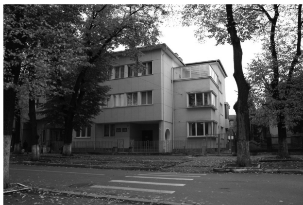
Функціоналізм. Вілла Маргошеса. Будівля 1939 р. Вул. Шевченка, 79.

Ще одним виразним прикладом архітектурного твору Ф. Януша є будинок по вул. Незалежності, 11. Підкреслена кубічність граней архітектурних форм, балкончики, декоровані простими лінейними вертикально розташованими металевими стрижнями решітки, стилістично підтримують художнє звучання будівлі. Декоративними акцентами на фасаді виступають скульптури хлопчиків на 2-му поверсі і чоловіча і жіноча постаті – на верхньому. Будинок наріжний, тому його кутова частина заокруглена, раніше продовжувалася у невеличку башточку з напівсферичним куполом (сьогодні ці елементи відсутні). Пізнішим зразком такої стилістики є остання міська ратуша, запроектована архітектором С. Трелею. Вона виконана у стилі ар деко: каркасна конструкція будинку-вежі поєднується з традицією використання декоративних форм зі стилізованими неокласичними елементами.