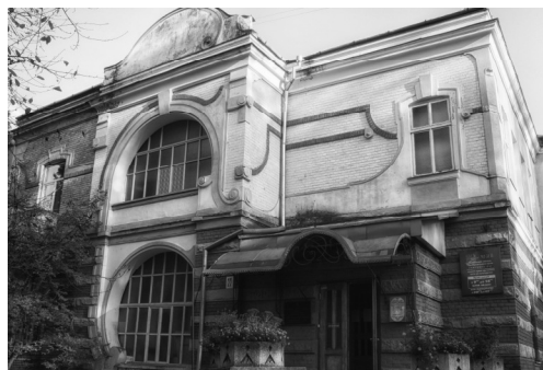
Зріла сецесія 1903–1908 рр. Музей визвольних змагань Прикарпатського краю. Вул. Тарнавського, 22.

Сецесійний декор також має певну своєрідність. Багатою декоративною пластикою відзначається будівля по вул. Академіка Гнатюка, 2. Стильове звучання тут виражене через композицію із медальйонів і стилізованих квітів – ромашок. Вони підкреслюють пілястри будинку і напружені вигини кронштейнів. Ця споруда належить до орнаментальної сецесії (раннього періоду розвитку стилю). Прикладом зрілої модерної стилістики в архітектурному середовищі є музей визвольних змагань Прикарпатського краю по вулиці Тарнавського, 22. Оформлення віконного прорізу цієї споруди нагадує форму великої літери грецького алфавіту – омега (Ω). Цікавим художнім вирішенням відзначаються житлові будинки по вулиці Незалежності, 16, 18, і 30 [6, с.15]. Для модерної стилістики характерна багата декоративна пластика: об'ємні скульптури, ліпнина. Сецесійні маскарони переважно виражені через жіночий портрет зі стилізованим розвіяним волоссям. Зустрічаються на вулицях: Гординського, 4, Грушевського, 37, Шевченка, 69 тощо. Об'ємні форми представлені химерами (вул. Шевченка, 44), також можна виявити жіночі фігури, одягнені у легкі драпіровані тканини, подібні до античного костюма (вул. Тарнавського, 22), та чоловічі постаті – атланти (вул. Грушевського, 42, Незалежності, 30).