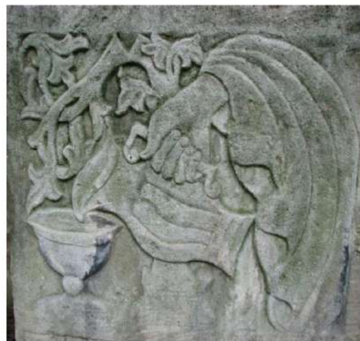
5. Надгробок рева рабі Аврагама Якова Гільфердінга, сина покійного учителя Цві Гірша Гільфердінга (1834 р.); м. Броди Львівської обл. 2007 р.