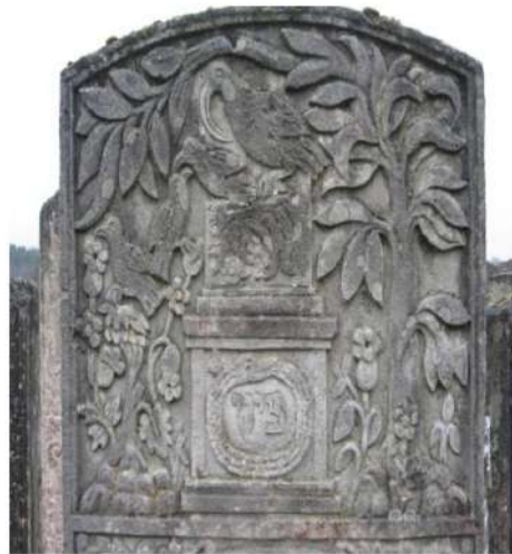
3. Надгробок рева Менахема Маніша Мордехая, сина Натана Йони (1836 р.); м. Броди Львівської обл. Фото автора, 2007 р.