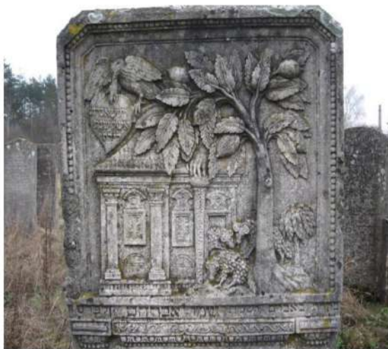
4. Надгробок Рахель, доньки рева Еліягу Шімхи Фрідмана (1896 р.); м. Броди Львівської обл. Фото автора, 2007 р.