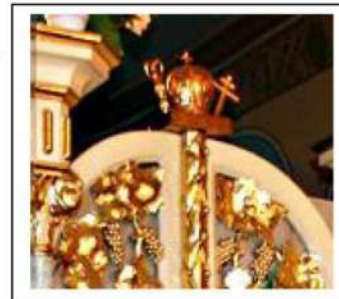
Іл.5. Завершення царських воріт, дерево, різьба, позолота, церква Благовіщення Пресвятої Діви Марії, м. Стрий.