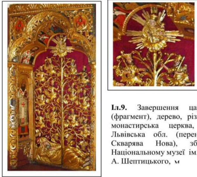
Іл.9. Завершення царських воріт (фрагмент), дерево, різьба, позолота, монастирська церква, с. Жовква, Львівська обл. (перенесений в с. Скварява Нова), зберігається в Національному музеї ім. Митрополита А. Шептицького, м