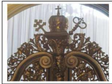
Іл.4. Завершення царських воріт, дерево, різьба, позолота, церква Преображення Господнього, м. Львів, початок ХХ ст.