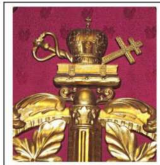
Іл.3. Завершення царських воріт іконостасу, (декоративний елемент), дерево, об'ємно-ажурне різьблення, позолота, собор Святої Покрови, м. Івано-Франківськ, 1994р.