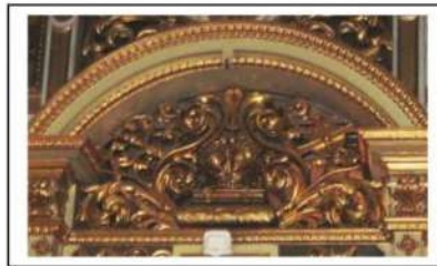
Іл.2. Надбрамне рельєфне зображення на іконостасі, ажурне різьблення, позолота, Івано-Франківський катедральний собор Святого Воскресіння, кінець XIX – початок XX ст.