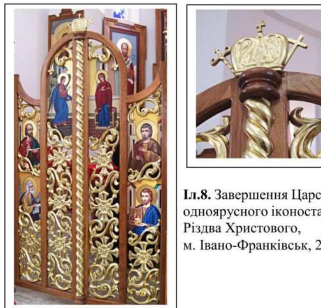
Іл.8. Завершення Царських воріт одноярусного іконостасу, церква Різдва Христового, м. Івано-Франківськ, 2000р.