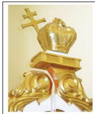
Іл.6. Завершення царських воріт, різьблення, фарбування, позолота, церква Успіня Пресвятої Богородиці, с. Кринос Галицький р-н, Івано-Франківська обл.