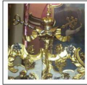
Іл.1. Завершення царських воріт іконостасу, дерево, різьба, позолота, посріблення, собор Св. Юра, м. Львів, 1768р.