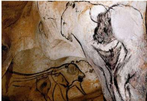
Рис. 1. Зображення пари жінки-левиці та чоловіка-бізона у печері Шове (Франція). 34,6–32,7, 30 410 ± 720 р. до н. е.

Найдавнішим зображенням пари є виявлене у печері Шове зображення двох півлюдей-півтварин – чоловіка-бізона та жінки-левиці, яке згідно з радіовуглецевим аналізом датується 34 600–32 700 р. до н. е. та 32 700–30 410 ± 720 р. до н. е. В образі жінки-левиці культ жінки-матері синтезувався з культом лева-тотема, ідея продовження роду поєдналася з ідеєю кровнородинних зв'язків людини з найсильнішим хижаком, що був зооморфним образом сили, лідерства і влади. Яскравими прикладами таких уявлень є три фігурки жінок-левиць із печер Штадель, Холе-Фельс, Гайсенкlostерле масиву Холенштайн на плато Швабський Альб. У зображенні териантропів у печері Шове тема продовження роду і походження його від звіратотема отримало подальший розвиток, оскільки жінка-левиця зображена разом з чоловіком-бізоном як подружня пара (рис. 1).