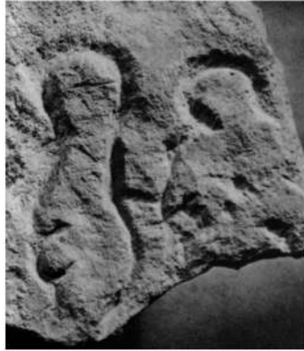
Рис. 2. Барельєфне зображення двох антропоморфних фігур (14, 5 і 10 см) на плитці вапняку з печери Терм Піала (Дордонь, Франція, Музей перигора).

Одна з постатей (та, що зліва) має ознаки жіночої статі: випнутий вагітний живіт, груди, які звисають на нього, і характерний вигин між спиною і сідницями. Можна припустити, що інша постать, від якої збереглася лише верхня половина, була чоловічою.