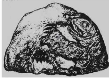
Рис. 4. Камінь із зображенням черепахи та орла з поселення Мала Сія. 32 500+–400, 31060+–450 років до н.е. (Росія). Джерело: Ларичев В. Е. 1979. С. 66.

символізувати верхню зону світобудови – небо. На одному з каменів Малої Сії орел зображений у парі з черепахою (рис.4).