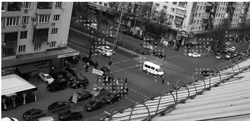
Рис. 5. Приклад розташування «істинних» блоків руху, що представлено векторами в блоках 8 \times 8 , 16 \times 8 та 8 \times 16 на зображенні, після фільтрації