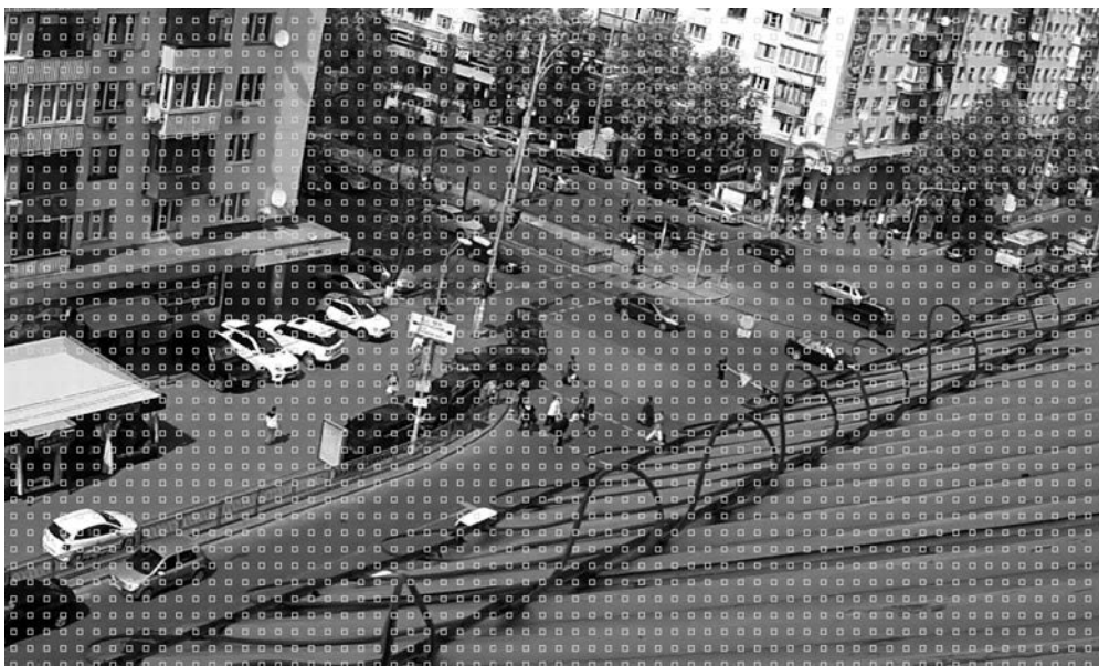
Рис. 3. Приклад розташування усіх блоків руху на зображенні (позначені квадратами)