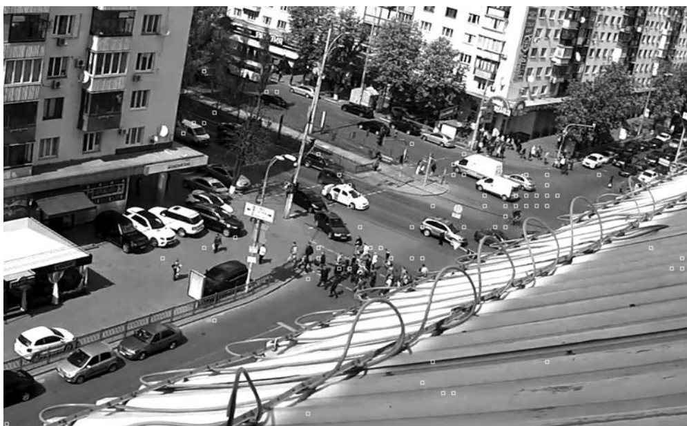
Рис. 4. Приклад розташування «помилкових» блоків руху, що представлені векторами в блоках 16 \times 16 на зображенні, після фільтрації

нення, оскільки від цього залежить надійність результату. Найчастіше використовують порогове значення. Якщо відстань вектора менше заданого порогового значення, вектор руху не враховують. Додатково застосовують медіанний фільтр разом з усереднюючим. У [7] запропоновано деякий модифікований фільтр Mean-Accumulated-Thresholded (MAT) filter. У [4] використовують каскадний фільтр, який складається з двох послідовних фільтрів Гауса та медіанного.