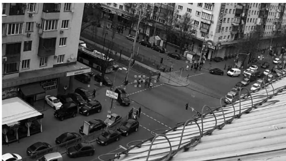
Рис. 6. Приклад розташування «істинних» блоків руху, що представлено векторами в блоках 8 \times 8 , 16 \times 8 та 8 \times 16 на зображенні, після фільтрації

Для знаходження «істинних» блоків руху ми знаходимо лише довжини векторів руху в блоках 8 \times 8 , 16 \times 8 та 8 \times 16 , оскільки виявили, що «помилкові» блоки частіше знаходяться в неподілених макроблоках 16 \times 16 (рис. 4). А «істинні» блоки руху представлено векторами в блоках 8 \times 8 , 16 \times 8 та 8 \times 16 . Приклади подано на рис. 5 і 6, де «істинні» блоки руху на зображенні виділено квадратами.