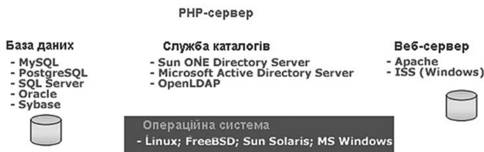
Рис. 1. Архітектура Moodle

EyeOs – кросплатформенна мережева операційна система (ОС), заснована на принципі «хмари». Базовий комплект EyeOS включає власне операційну систему і декілька офісних додатків – текстовий редактор, календар, файловий менеджер, месенджер, веб-браузер, калькулятор і деякі інші. ОС не потребує установки програмного забезпечення на конкретний локальний комп'ютер. Робочий стіл, використовувані додатки і вся необхідна інформація доступні, за умови доступу в Інтернет, з будь-якого сучасного браузера з підтримкою AJAX. Moodle написана мовою PHP з використанням баз даних (SQL, MySQL, PostgreSQL чи Microsoft SQL Server) і може працювати з об'єктами SCO та відповідає стандарту SCORM. Архітектура Moodle має структуру, представлену на рис. 1.