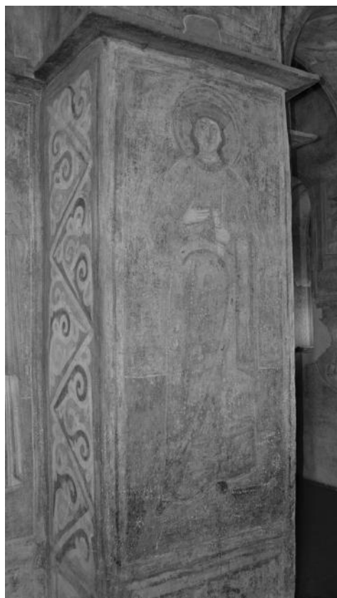
Рис. 6. Св. цариця Олена. Фреска на стовпі нефа вітгара свв. Якіма та Анни. Близько 1018 р.