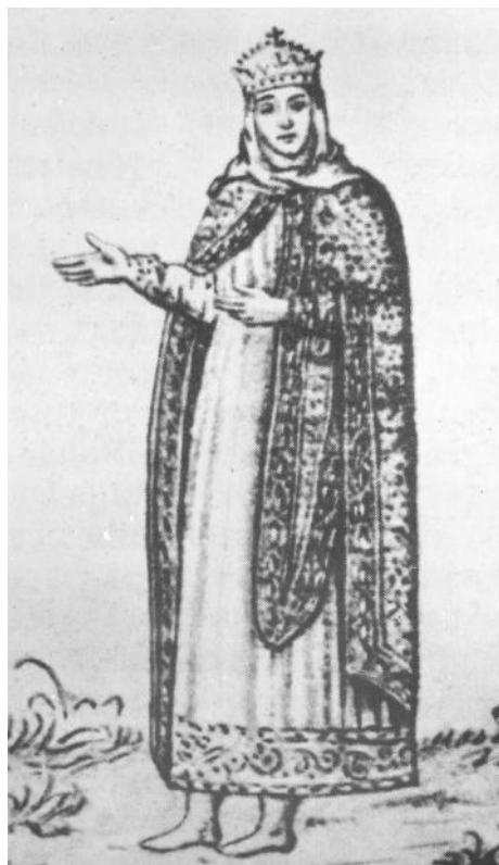
Рис. 4. Княгиня Анна. З княжого портрета родини Володимира у Софії Київській, замальованого у 1651 р. А. ван Вестерфельдом. Близько 1018 р.