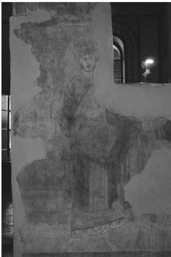
Рис. 7. Свв. Костянтин та Олена. Фреска на стіні нефа Михайлівського вівтаря. Близько 1018 р.