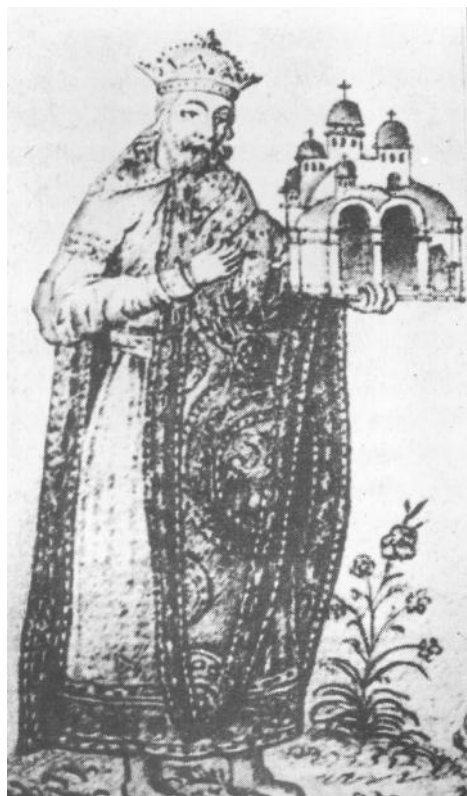
Рис. 3. Князь Володимир з моделлю Десятинної церкви. З княжого портрета родини Володимира у Софії Київській, замальованого у 1651 р. А. ван Вестерфельдом