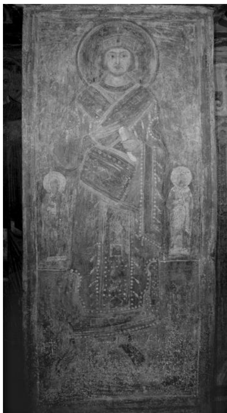
Рис. 5. Св. Костянтин Великий. Фреска на стовпі нефа дяконіка. Близько 1018 р.