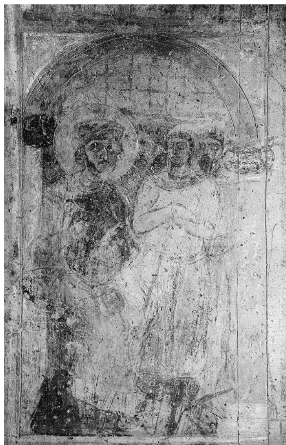
Рис. 1. Імператор Василь II у ложі іподрому. Фреска південної вежі Софії Київської. Близько 1018 р.

ім'я, як це практикувалося у Візантії, що саме по собі свідчить про її велику роль у хрещенні Русі. Арабський історик XI ст. Ях'я Антіохійський особливо відзначає місіонерську і храмобудівничу діяльність Анни, яка «побудувала численні церкви в країні русів» (Розен 1883, с. 24). Лише в середині XIII – на початку XIV ст., коли були канонізовані Володимир і його бабка Ольга,