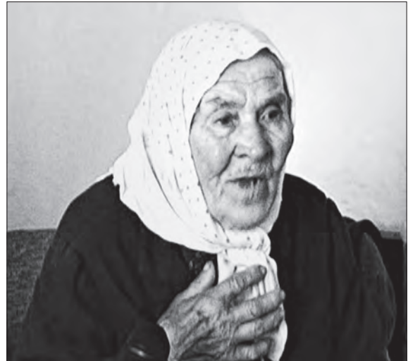
«Приходи парень до нас і просьється...»

ISSN 1028-5091. Народознавчі зошити. № 3 (99), 2011