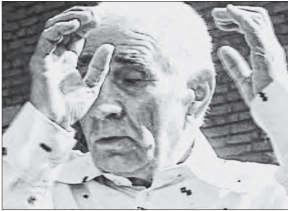
«...у яму вкїнули, загорнїли»

ни до ями, очі дивляться вниз, до тієї ж могили. Взивання Бога за свідка.