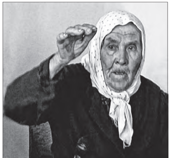
«І хлопчик із нею, отакій завбільшки»

Вказівний жест оповідачки: піднята вгору права рука, повернута долонею вниз, фіксує ріст хлопчи-