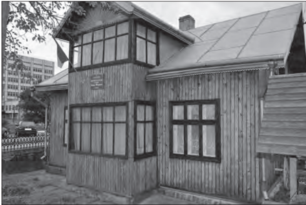
Музей Івана Франка в Калуші. 2012