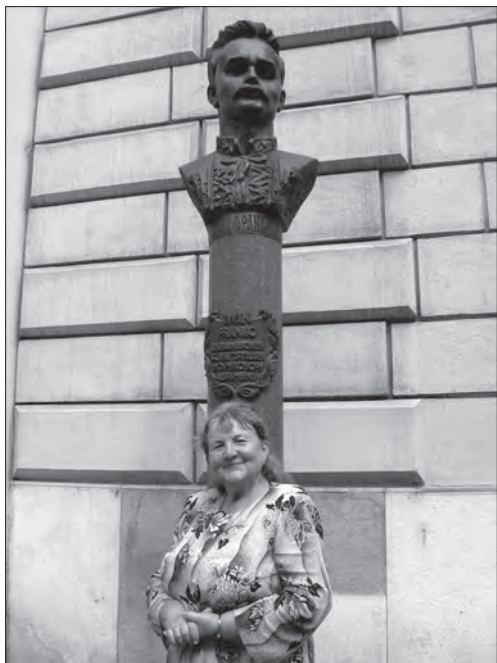
Пам'ятник Іванові Франку у Відні. 2010 р. Публікується вперше