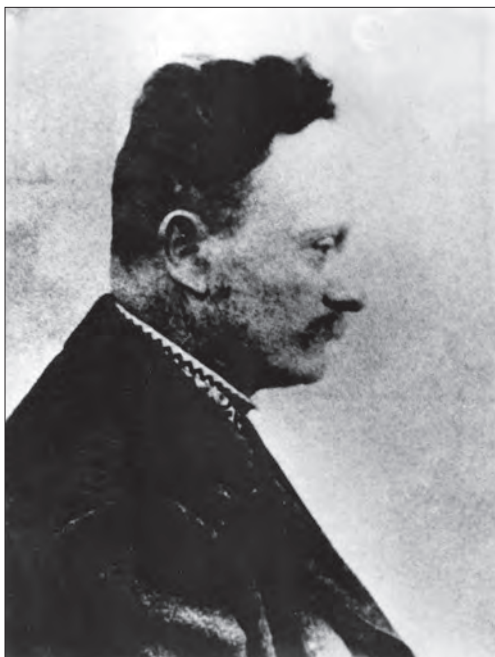
Іван Франко. 1904. Маловідома фотографія