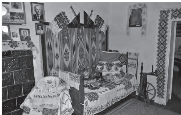
Інтер'єр Музею. Родинні етнографічні речі. 2012 р.