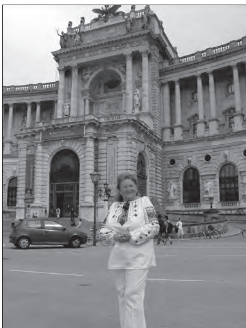
Центральна наукова бібліотека у Відні, де готувався до захисту дисертації Іван Франко (фото 2010 р.)

«Іван Франко» «збороздив» моря й океани світу, а після відправлення судна на заслужений відпочинок портрет був подарований до Музею [9, с. 5].