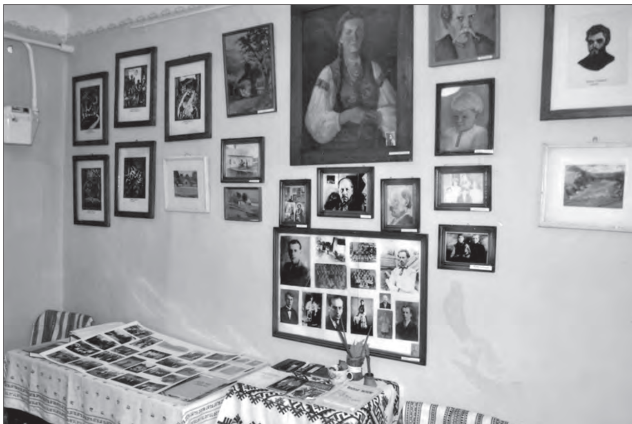
Картини Григорія Смольського в Музеї