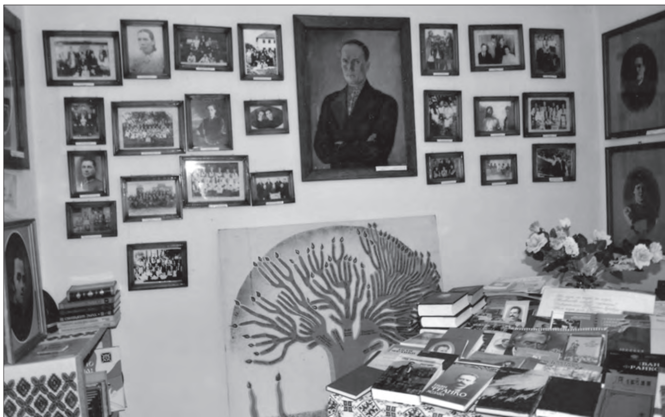
Інтер'єр музею (внизу художньо-графічне зображення генеалогічного дерева Івана Франка, яке налічує бл. 360 осіб)