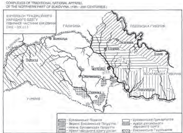
Іл. 1. Карта-схема: Комплекси традиційного народного одягу північної частини Буковини ХІХ—ХХ ст. — (Опубліковано: Кожолянко Ярослава. Буковинський традиційний одяг ... — С. 218)

Відомі з ХІХ ст. накладні оздоби з бісеру набули ще більшого поширення. У процесі розвитку технологічних та стилістичних засад художня структура оздоб зазнала істотних змін.