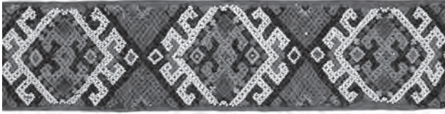
Іл. 2. Яворська М.І. Гердан стрічковий «герданик». Бісер, нитки, нанизування «сіточкою». Фрагмент. 1920-ті рр., с. Веренчанка Заставнівського р-ну Чернівецької обл. ЧОДМНАП, ПР-30