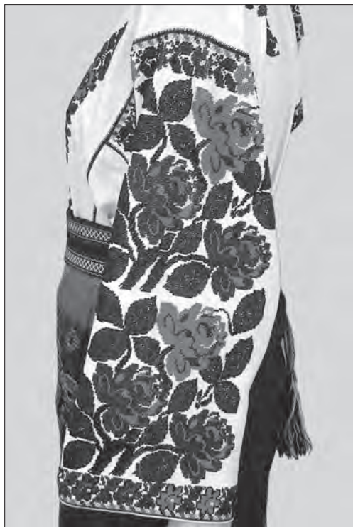
Іл. 11. Сорочка тунікоподібна жіноча додільна «плечиками та рукавами». Полотно, бісер, січка, вишивання «півхрестиком». Кінець 1930-х рр., с. Самушин Заставнівського р-ну Чернівецької обл. ЧОХМ, Т-1190 (Експозиція)