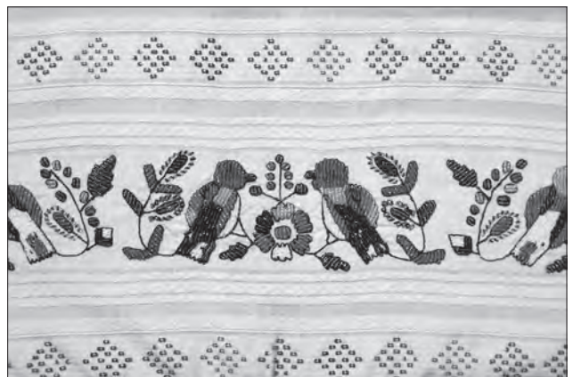
Іл. 9. Намітка «рушник». Лляні та бавовняні нитки, перебірне ткання, бісер, вишивання «уперед голкою» та «вільною гладдю» (бісер), «стебнівкою» (нитки). Фрагмент. 1930-ті рр., с. Діброва Кіцманського р-ну Чернівецької обл. ЧОДМНАП, КВ-6244