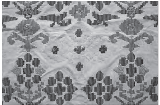
Іл. 8. Намітка «рушник». Лляні та бавовняні нитки, перебірне ткання, бісер, вишивання «півхрестиком». Фрагмент. Перша половина ХХ ст., с. Мосорівка Заставнівського р-ну Чернівецької обл. ПМА за 26 червня 2007 р.