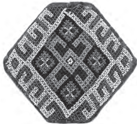
Іл. 6. Квітка. Бісер, нитки, нанизування «сіточкою». 1920-ті рр., с. Веренчанка Заставнівського р-ну. ЧОДМНАП, ПР-36

формотворчі можливості нових технік, особливо ткання. Проте, ткання позбавило технічний орнамент 4 прикраси такого важливого (притаманного нанизуванню) засобу художньої виразності як ажурність. Тому, щоб урізноманітнити декоративну структуру бісерної прикраси, щонайбільше розеткового гердану, буковинські майстри застосовували одночасно із тканням (основні орнаментальні площини) техніку