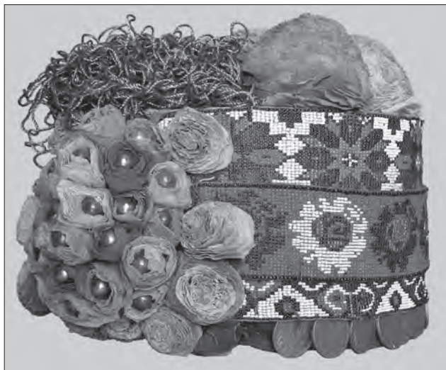
Іл. 7. Вакарюк М.І. Весільний вінок «капелюшиння». Картонний корпус, нитки, бісер, тканиня. 1920-ті рр., с. Брідок Заставнівського р-ну Чернівецької обл. ЧОХМ, Т-102

набирання в разки або нанизування (проміжки між основними орнаментальними площинами) [18].