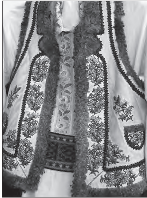
Іл. 18. Кептар. Вибілена шкіра, сірий смушок, січка, бісер, вишивання. Середина ХХ ст., с. Топорівці Новоселицького р-ну Чернівецької обл. ЧОКМ, III-18938 (Експозиція)

При вишиванні кептарів використовували дещо крупнішу (№ 11, 10), аніж при вишиванні сорочок, січку різних гатунків, що впливало на масштаб мотивів. Часто елементи мотивів виконували застосо-