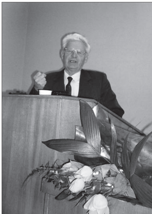
Виступ на науковій конференції

1958), молодшого наукового співробітника відділу літератури Інституту суспільних наук АН УРСР (з 1958 р.), старшого наукового співробітника цього ж відділу (1964—1972), старшого наукового співробітника відділу етнографії Державного музею етнографії та художнього промислу АН УРСР (1972—1980), завідувача цього ж відділу (1981—1992), завідувача новоствореного відділу фольклористики у тоді вже Інституті народознавства НАН України (1993—2001), старшого наукового співробітника цього ж відділу (2001—2003), старшого наукового співробітника відділу етнології сучасності цього ж Інституту (2003—2004), провідного наукового співробітника цього ж відділу (з 2004 р. і дотепер).