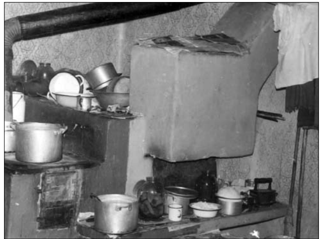
Напівкурна піч, с. Смерекова, Великоберезнянський р-н, світлина В. Сивака. 1991 р.