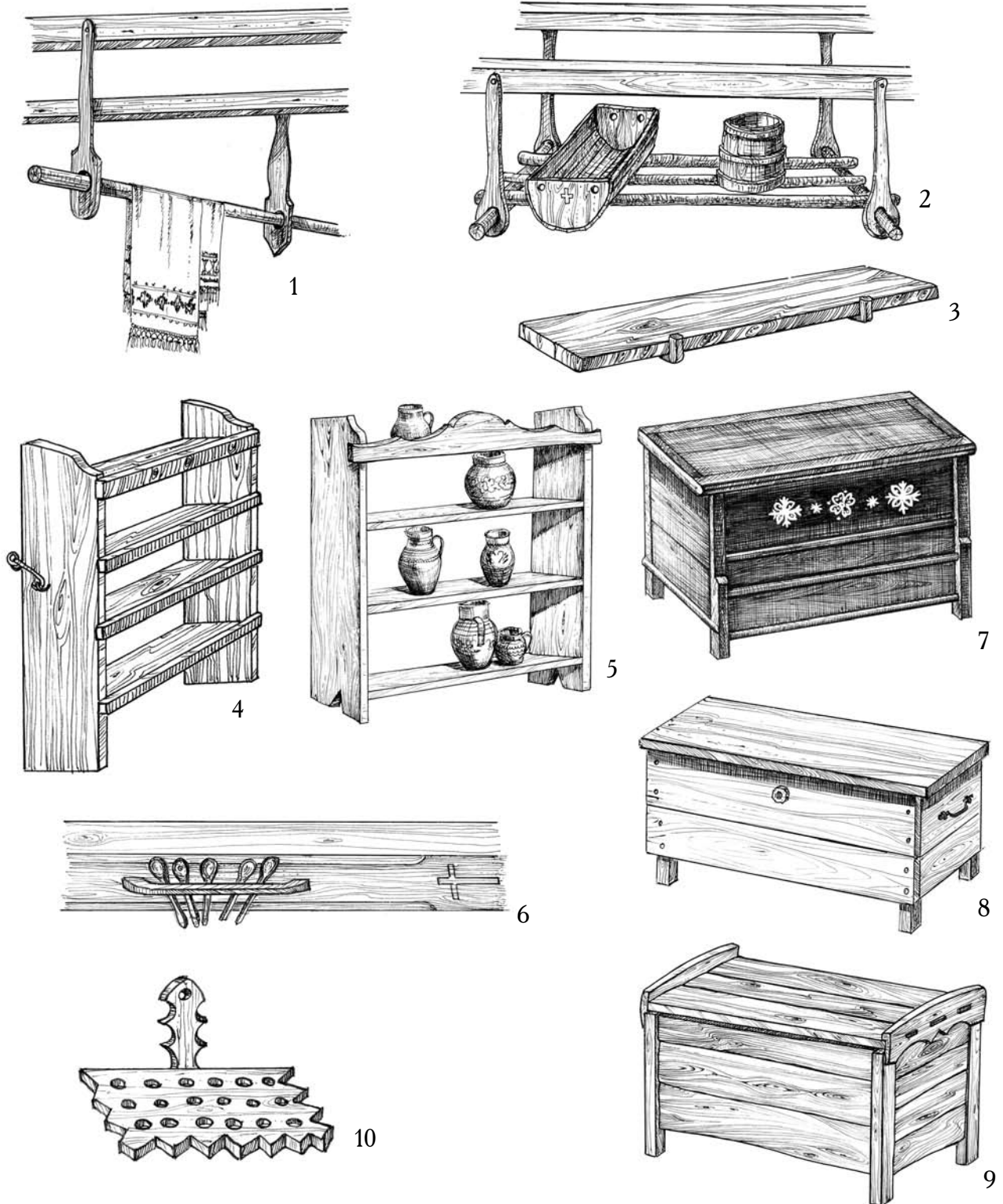
1. Жердка «дручок», с. Ростоцька Пастіль, Великоберезнянський р-н. 2. Жердки «дрючки», с. Новоселиця, Перечинський р-н. 3. Полиця, с. Ростоцька Пастіль, Великоберезнянський р-н. 4. Полиця «подишир», с. Тур'я Поляна, Перечинський р-н. 5. Полиця «талаш», с. Зарічево, Перечинський р-н. 6. Утримування ложок під сволоком над столом, с. Ростоцька Пастіль, Великоберезнянський р-н. 7. Скриня-«лада», с. Ростоцька Пастіль, Великоберезнянський р-н. 8. Скриня «ладичка», с. Смерекова, Великоберезнянський р-н. 9. Сусік, с. Зарічево, Перечинський р-н. 10. Ложник, с. Зарічево, Перечинський р-н. Рисунки В. Сивака