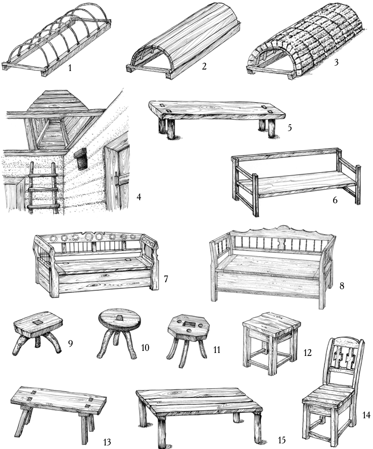
1, 2, 3. Етапи спорудження склепіння печі, с. Тур'я Поляна, Великоберезнянський р-н. 4. Іскрогасник «коминча», «сліпий комин», с. Зарічево, Перечинський р-н. 5. Лава на вкопаних у землю ніжках, реконструкція. 6. Лава-канапа для сидіння, с. Тур'я Поляна, Перечинський р-н. 7. Лава-«шафарня», с. Турички, Перечинський р-н. 8. Лава-«шефарня», с. Зарічево, Перечинський р-н. 9. Стілець «стульча», с. Зарічево, Перечинський р-н. 10. Стілець, с. Стужиця, Великоберезнянський р-н. 11. Стілець, с. Стужиця, Великоберезнянський р-н. 12. Табурет «настоящий столець», с. Зарічево, Перечинський р-н. 13. Лава-ослін, с. Зарічево, Перечинський р-н. 14. «Заплечистий» стілець, с. Зарічево, Перечинський р-н. 15. Нари, реконструкція. Рисунки В. Сивака