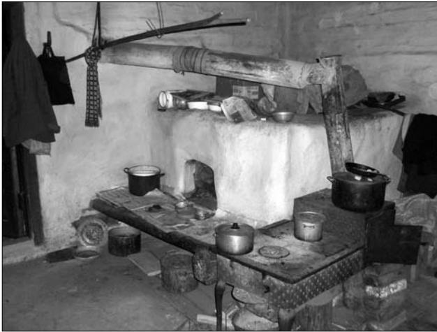
Курна піч, с. Люта, Великоберезнянський р-н, світлина Р. Радовича. 2009 р.

XIX — на початку XX ст. побутували хати, печі у яких були різні: а) без коминів, дим вільно розходився по приміщенню (курна піч); б) дим відводився в сіни чи на горище через спеціально примуровані пристрої (напівкурна піч); в) печі з вимуруванням на горищі комином, у зв'язку з чим дим відводився поза межі даху. Залежно від системи опалення етнологи означають житла трояко: курна, напівкурна, «чиста хата» або «біла хата» [6, с. 121; 9, с. 270; 12, с. 278]. Лемки Закарпаття називають курні хати двояко: «димнянки», «курні хижі» [2, арк. 63; 16, с. 211].